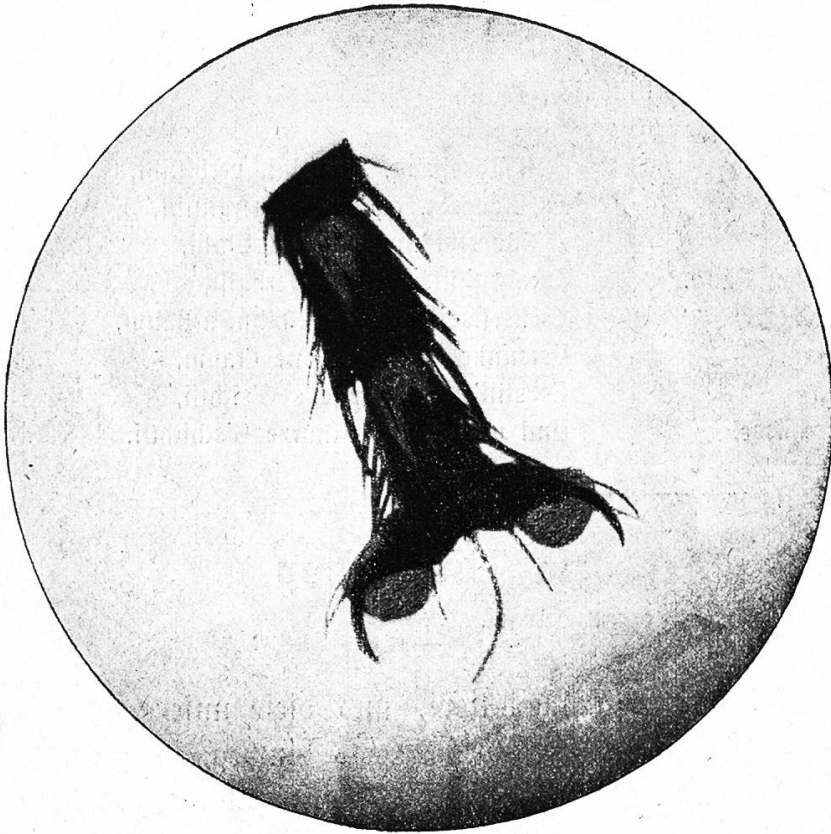
Fliegenfuß bei 2000facher Vergrößerung.

dere Beilage in der Suppe. Aber im Ernst gesprochen, es gibt kaum ein unästhetischeres und vor allen Dingen gesundheitschädlicheres Tier als die Fliege, eben weil sie direkt den Unrat zc. auf unsere Speisen überträgt, und außerdem auf dieselben ihre Eier ablegt, aus denen sich in kaum 24 Stunden die Fliegenmaden entwickeln. Man macht auf andere Insekten, Flöhe, Wanzen, Küchenschwaben, Läuse zc. mit Eifer Jagd, die Fliege indessen, gegen