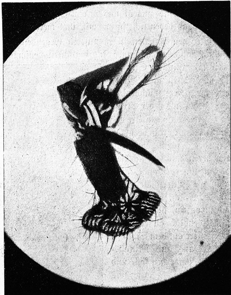
Rüssel der Fliege bei 1200facher Vergrößerung.

die jene anderen Plagegeister noch verhältnismäßig harmlos sind, wird als notwendiges Übel zumeist geduldet. „Ein kleines Tierchen, was ist dabei!“ — so sagen viele; aber wer einmal Gelegenheit hatte, dieses kleine Tierchen genauer zu betrachten, etwa unter einem guten Mikroskop, der wird entsetzt gewesen sein über das fürchterliche Untier, das sich seinen Blicken darbietet. Ein riesiger Kopf, so groß wie ein Apfel, mit zwei thalergroßen Bitteraugen blickt uns entgegen, aus dem vorn ein komplizierter Ap-