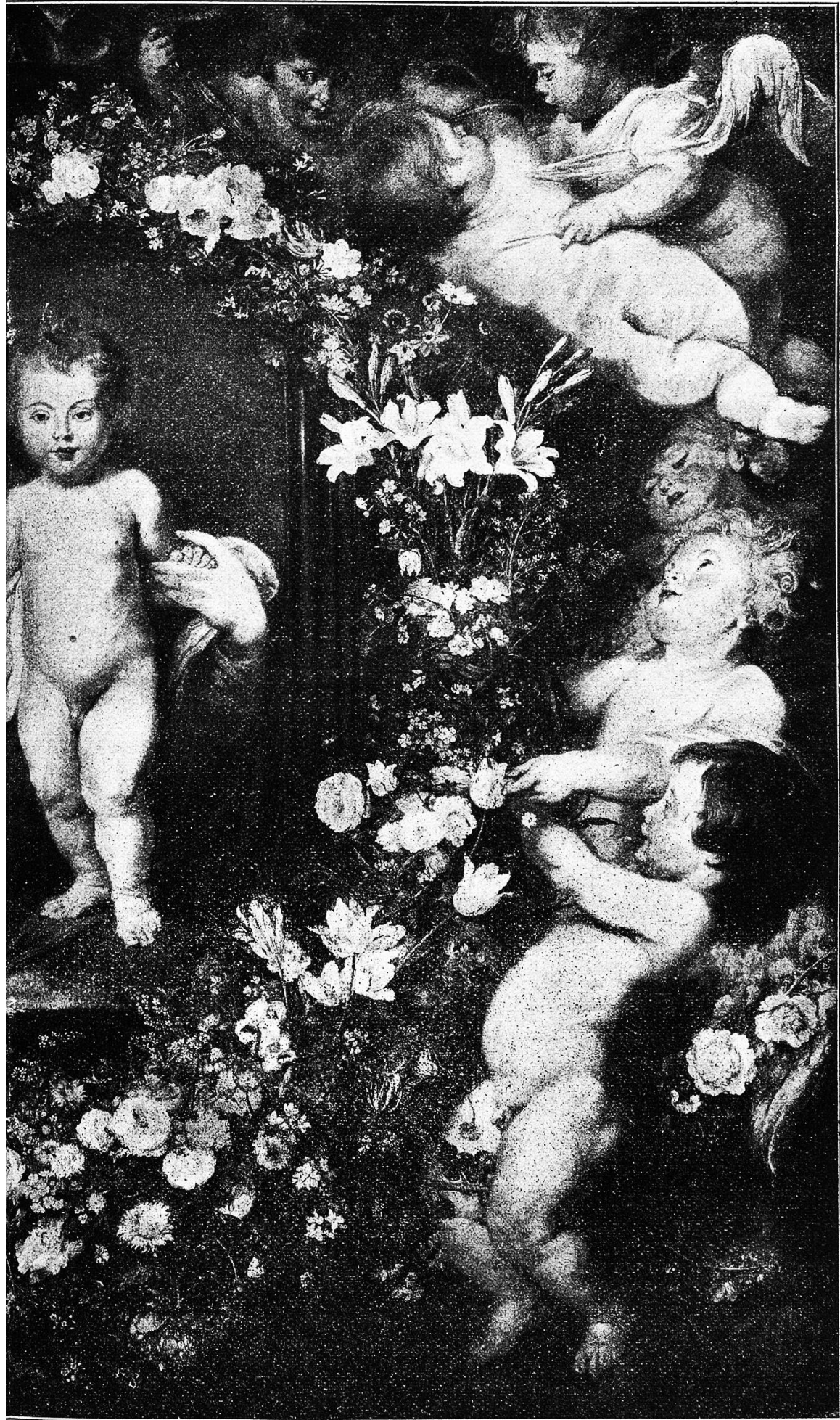
Das Gemälde von Peter Paul Rubens.