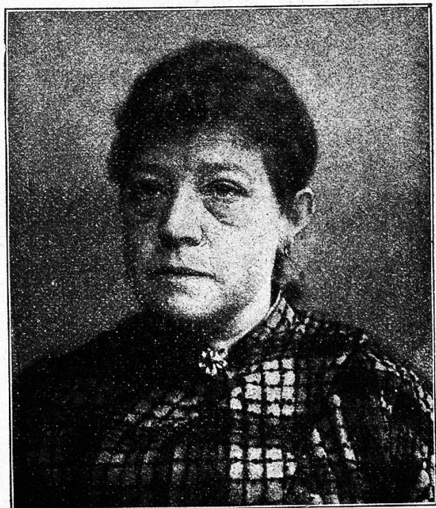
Schilddrüsenchwund seit 16 Jahren bestehend. Oben vor der Behandlung (Gewicht 79 Kilogramm), unten nach zehnwöchentlicher Behandlung (Gewicht 59 Kilogramm). Nach A. Magnus.