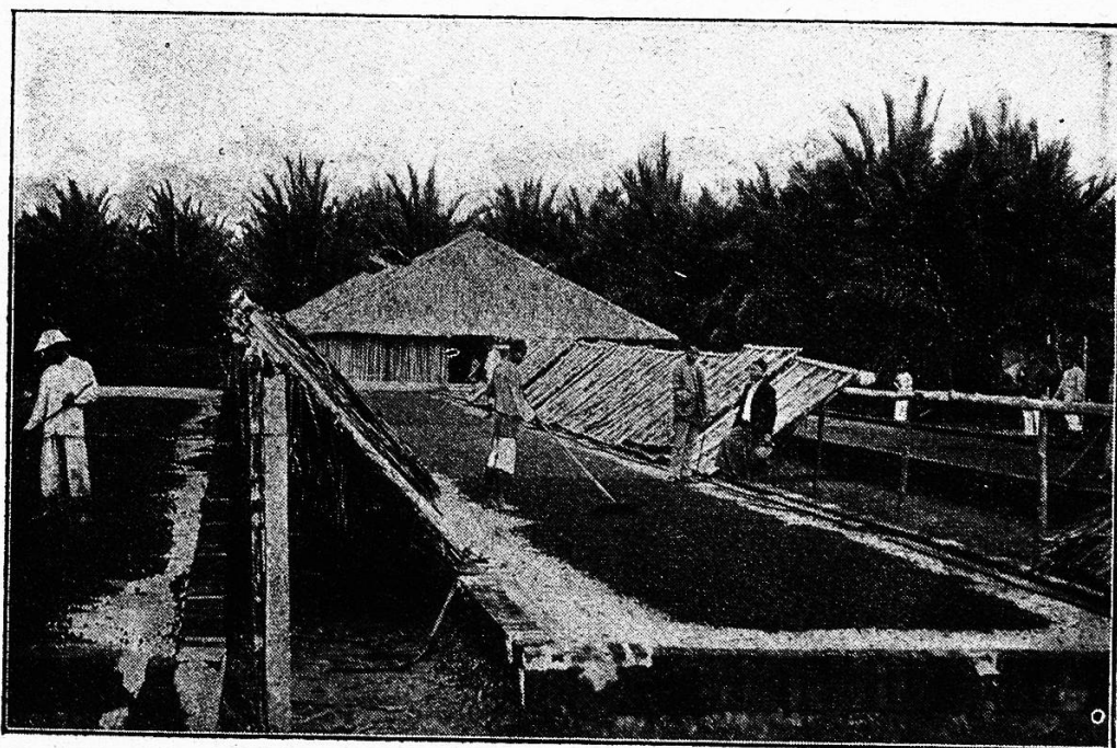
Trocknen des Kaffees

nach wenigen Tagen tritt eine Gärung ein, die sich durch einen starken, sauren Geruch bemerkbar macht. Nach etwa 3—4 Wochen ist dieser Trockenprozeß beendet. Reinlichste Sorgfalt ist bei diesem Verfahren Bedingung, da bei einer zu frühen Anhäufung die Bohnen infolge der in ihren fleischigen Hüllen enthaltenen Gerbsäure leicht gären, wodurch das in den Bohnen enthaltene Öl (Coffein) erhitzt und der Geschmack der Bohnen stark beeinträchtigt wird. Die auf oben beschriebene Art getrockneten Früchte haben inzwischen eine braune Farbe angenommen und etwa die Hälfte ihres Gewichtes verloren. Um die Bohnen von ihrem Fruchtfleisch und der sie unmittelbar umgebenden pergamentartigen Hülle zu befreien, werden sie in primitivster Aufbereitung, abgesehen von den bereits überall existierenden Schälmaschinen, in einen von den Eingeborenen gefertigten, zirka 70—80 Zentimeter hohen Holzmörser getan. Durch Stampfen mit einer hölzernen Quetsche lösen sich die Hüllen, während die Bohnen herausgequetscht werden. Dieses Verfahren ist natürlich sehr zeitraubend, da ein Arbeiter respektive eine Arbeiterin nicht mehr als un-