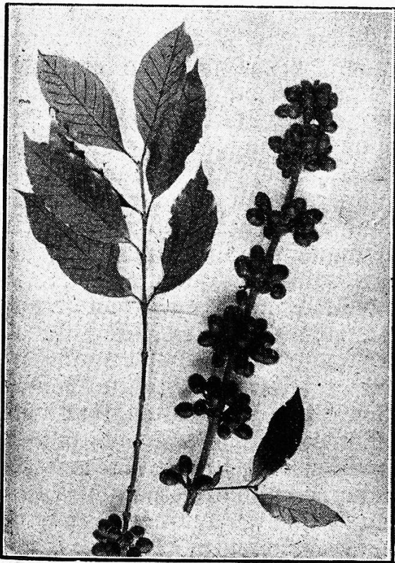
Kaffeezweig mit Früchten.