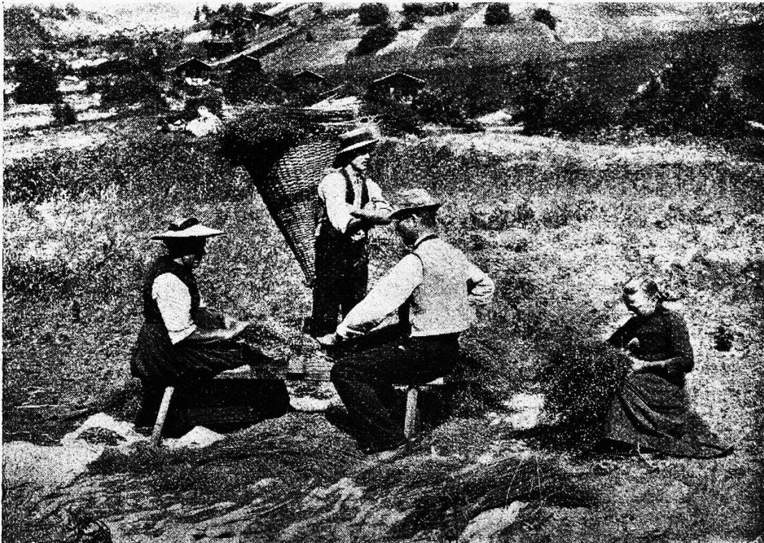
Das Riffeln des Hanfes.

Nur noch in wenigen Gegenden Deutschlands wird für den eigenen Wirtschaftsbetrieb das Leinen aus dem früher so sehr beliebten und selbst bereiteten Flachs gewebt. Das Spinnrad, welches noch vor wenigen Jahrzehnten in deutschen Familien ein von Alters her geheiligter Besitz der Hausfrau, Töchter und Mägde war, die in munterer Gesellschaft bei trau-