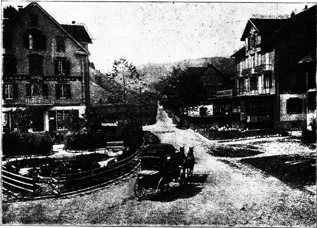
Dorfplatz in Unteryberg (Straße nach Oberberg).

schmucke Dorfschaften — Groß- und Gütal — mit weithin schimmernden Kirchen und stattlichen Schulhäusern flankieren die Straße. Stille Gehöfte sonnen sich auf grünem Plan, und durch der Matten weichen Teppich rieseln muntere Wasser der jungen Sihl zu, deren Lauf wir zweimal auf alten gedeckten Brücken passieren.