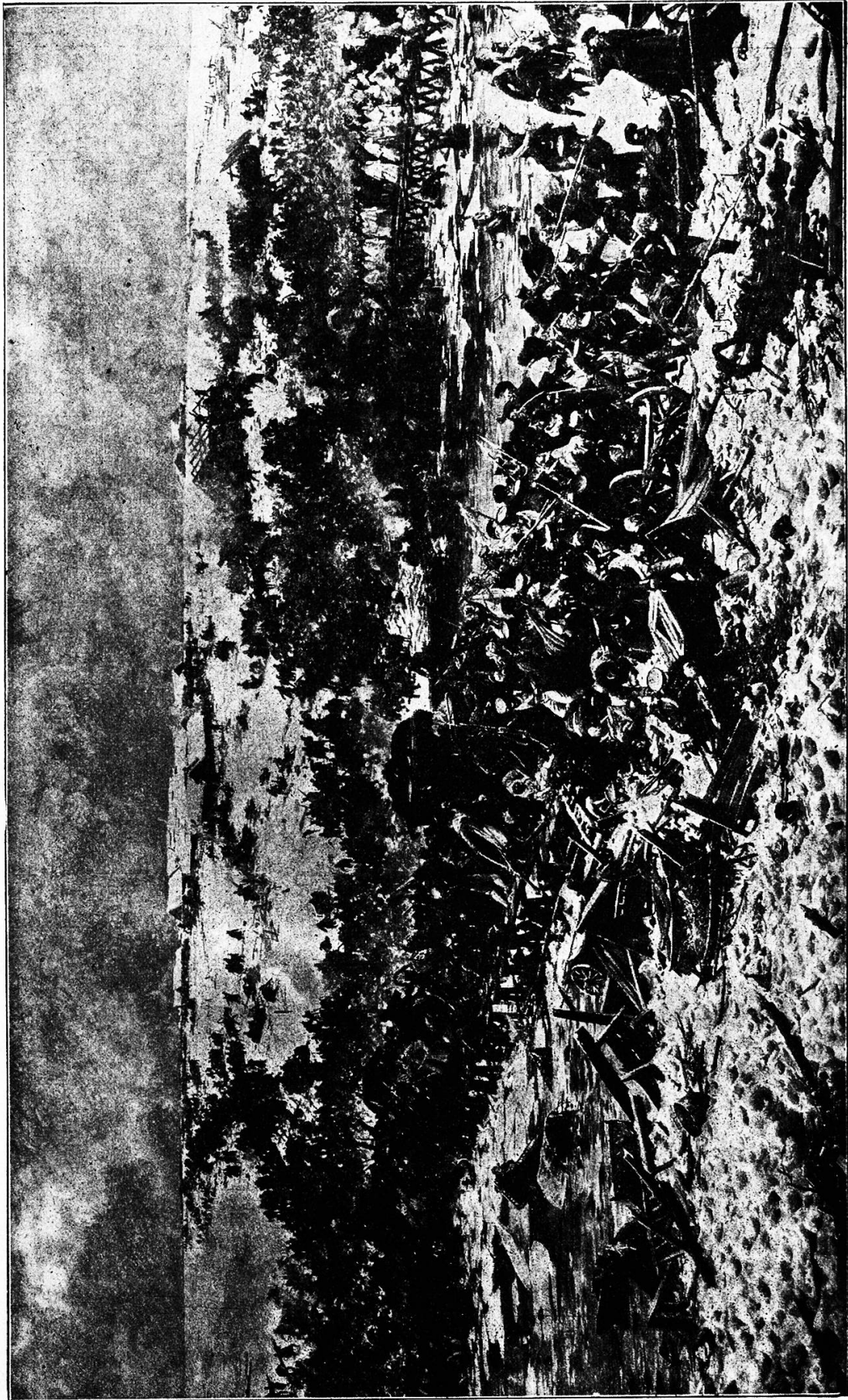
Uebergang der französischen Armee über die Beresina vom 25.—26. November 1812. Von J. Falat.