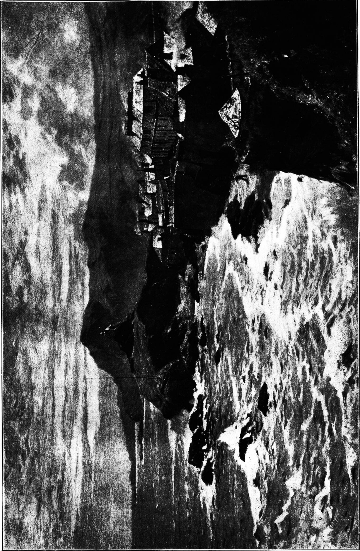
Englische Küste. Gemälde von Hermann Petzet.