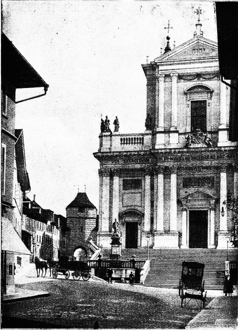
St. Ursus-Münster und Baseltor.

Die Stadt hat auf ihrem Marktplatz einen Turm, dessen kunstreiches Uhrwerk weit und breit berühmt ist. Eine Inschrift auf dem untern