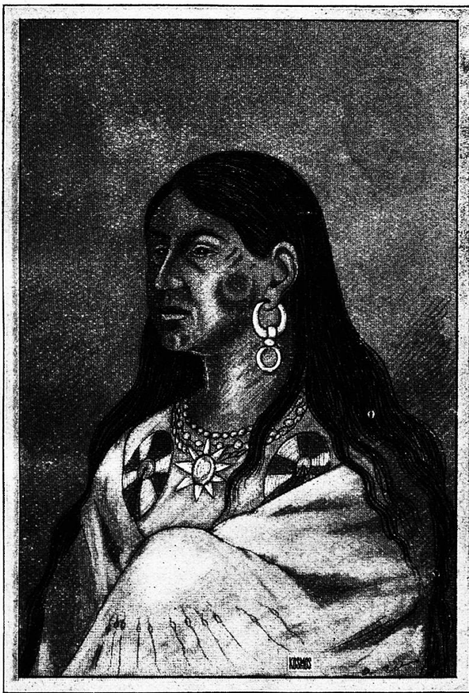
Abb. 1. Schwarzfuß-Indianerin. Nach einer Zeichnung Catlins.

Catlin, ein Advokat, der sich durch Selbststudium zum Maler herangebildet hatte, durchzog mit Pinsel und Palette die schier endlosen Prärien bis zu den Felsengebirgen der Rocky Mountains, von dem unbezwinglichen Verlangen getrieben, den Überrest einer aussterbenden edlen Menschenrasse in Wort und Bild der Nachwelt zu überliefern — Mac-Clintock hatte ähnliche Beweggründe. Er brauchte aber die Kamera, „die große Medizin“. Beiden gelang es während einer langen Probezeit, in der sie unauffällig scharf beobachtet wurden, sich durch Treue und Wahrheitsliebe das Vertrauen der Indianerstämme zu gewinnen. Mac-Clintock fühlte sich bei den „Schwarzfüßen“ besonders heimisch. Er erlernte ihre Sprache und wurde von ihrem Ober-