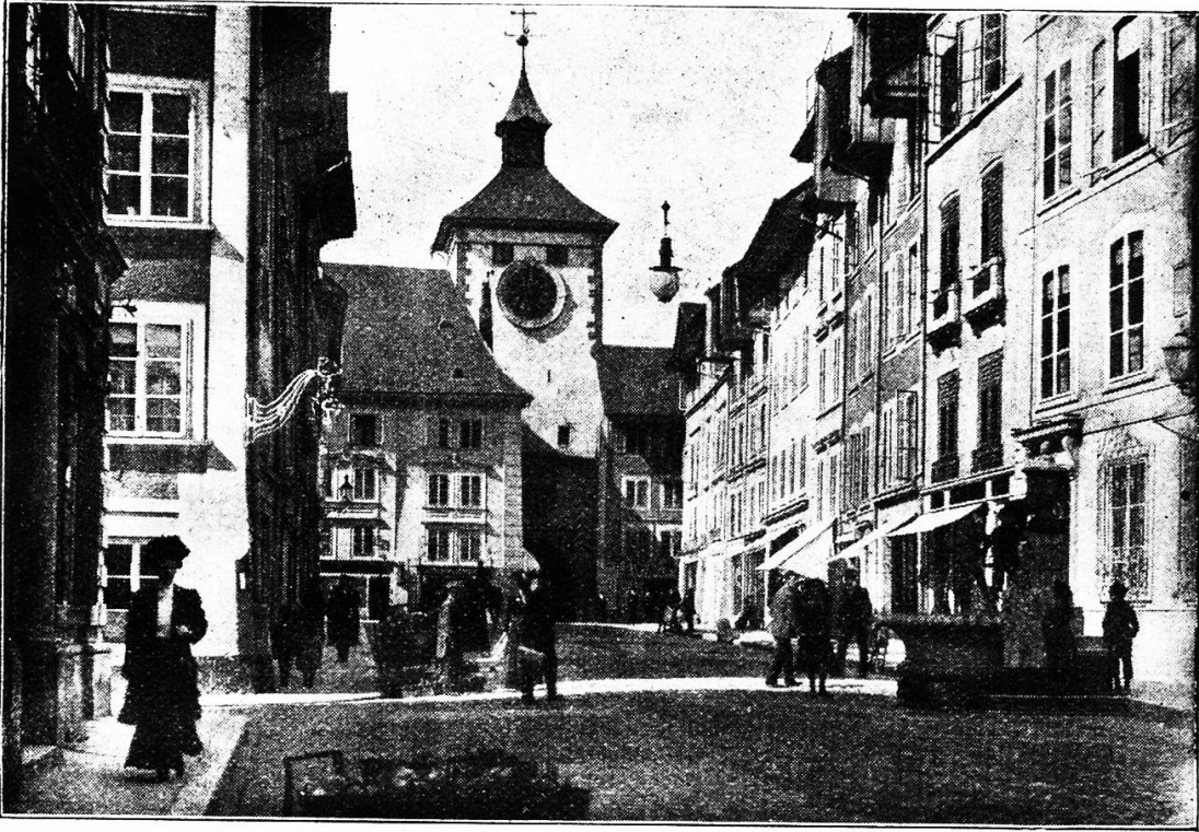
Marktplatz mit Bieltor.

Klösterlein Beinwil vorbei zum „Neuhäuslein“ und zur Paszwanghöhe angestiegen und nachdem er die Aussicht bewundert, nach Mümliswil und dem von den Falkensteiner Schlössern behüteten Balzthal abgestiegen ist, der wird diese Tour seiner Lebtag nicht mehr vergessen.