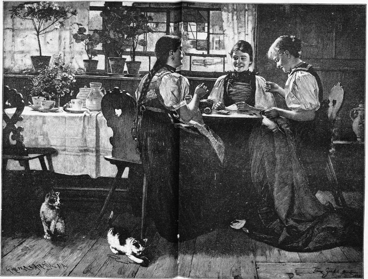
Bei der Arbeit. nach dem Gemälde von F. Grassel.