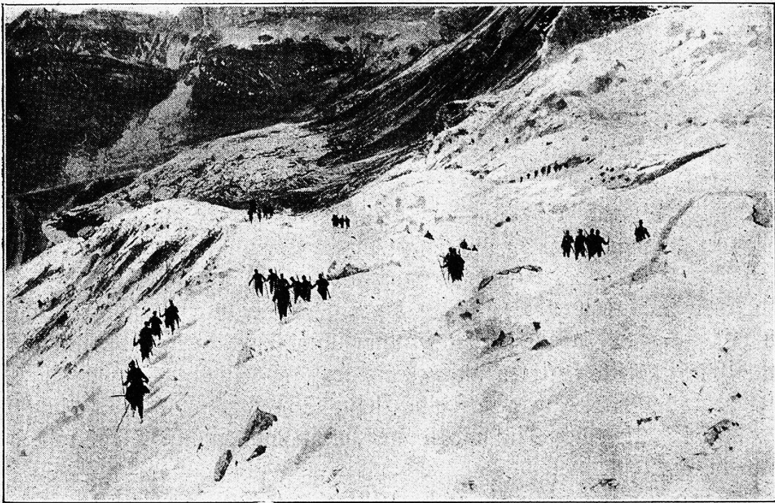
Gebirgstruppen im Marsche.