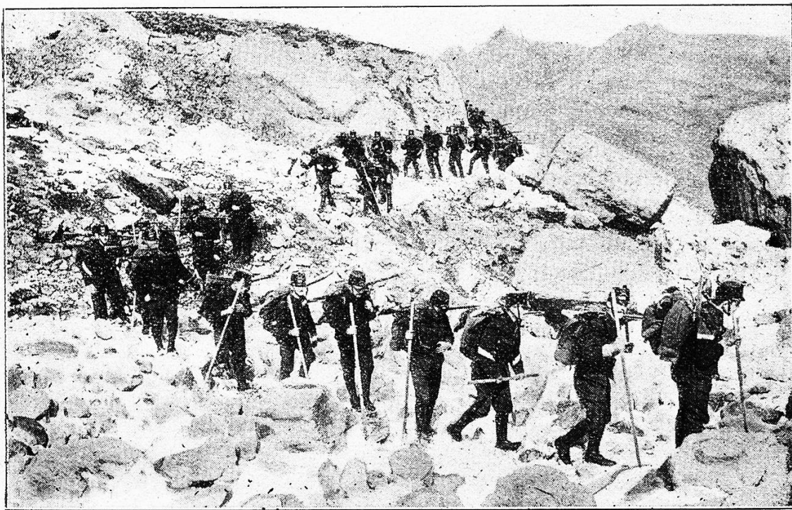
Unsere Gebirgstruppen im Marsche.

übernommen, mit Schulden, daß sich die Balken bogen in der Scheune. Er aber legte auf die Schulden seine heiße Arbeit. Da schmolz die Schuld. Da lag der Weidenhof blank und unverschuldet in der Sonne. Da nahm er sich ein Weib. Die schenkte ihm das Agathl, drehte sich an die Wand und starb. Um zu vergessen, rackerte er noch ärger als zuvor. Der Weidenhof bekam Hände. Der Weidenhof griff um sich und holte Äcker, Wiesen, ja, ein Stück Wald sogar am Königlichen Forst. Und als er sich genug gestreckt hatte, der Weidenhof, da ging er in die Höhe. Da kam das zweite Stockwerk auf das Haus, da setzte er sich eine Sägemühle an die Ache. Da wurde er des Forst-