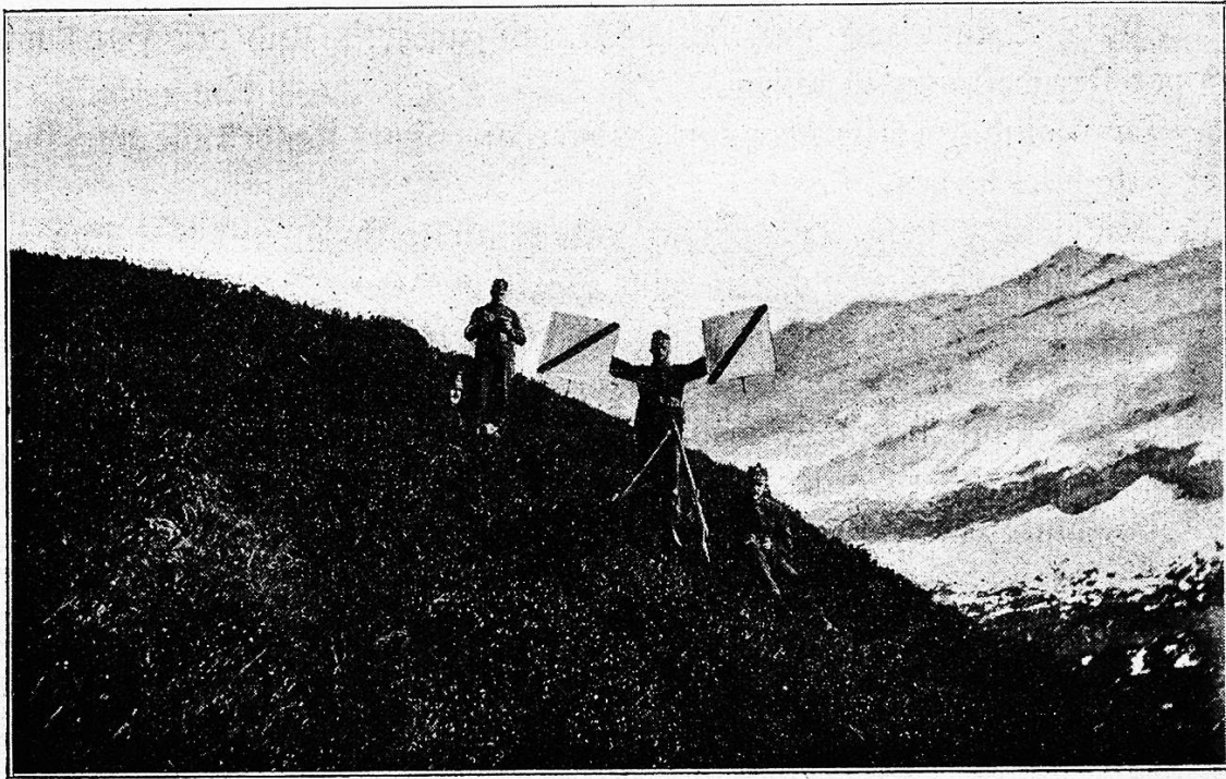
Gebirgstruppen beim Signalisieren.

Da tat der alte Keiser einen tiefen Schnaufser und malte so geschwind einen Buchstaben nach dem andern aufs Papier. So geschwind, wie er sein Lebtag noch nicht unterschrieben hatte. So — jetzt war's vorbei. Da stand es: Wilhelm Keiser. Und es kam ihm vor, als hätte sich mit jedem Buchstaben ein Stück von seinem Eigentum heruntergeschält. Aber es war ihm nicht betrübt zu Mute. Ganz und gar nicht. Leicht war ihm, federleicht. Fast so wie damals, als er die letzte Rate von des Vaters Schulden in die