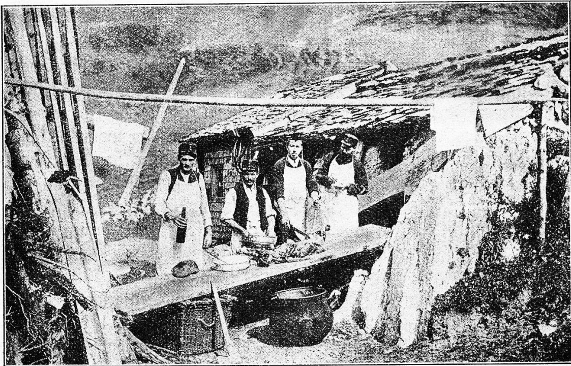
Schweizer Gebirgstruppen. Küche.