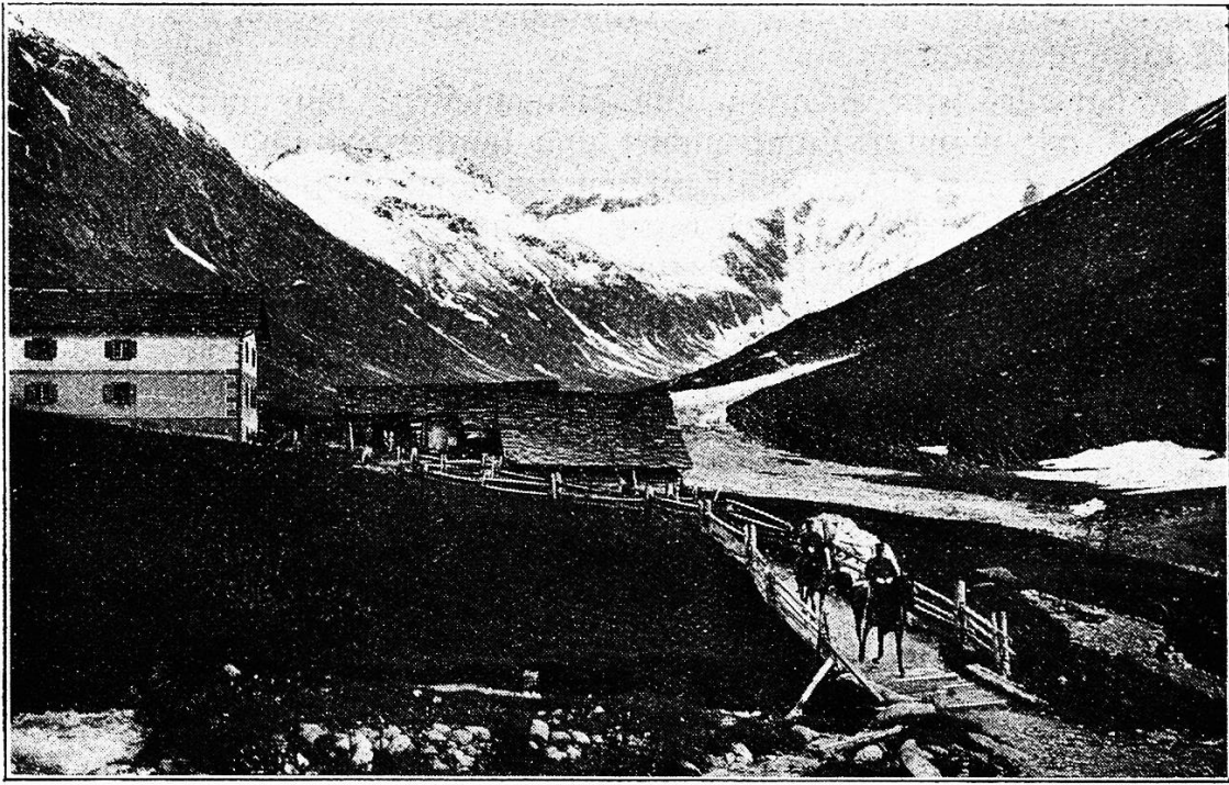
Juf im Abers-Tal, Graubünden, 2042 m. Höchster jahraus jahrein bewohnter Ort von Europa.

angestaunt. Ich meinerseits mußte feststellen, daß bei gleichen Talenten die ältern Maler allzusehr zu Verstand und Gemüt sprachen, auf Kosten der farbigen Realität. Alles scheint natürlich und lebensvoll gemalt und doch sagt dagegen die Auge des modernen Malers: nein, das ist gerade unnatürlich; so denkt man sich wohl, aber so sieht es in Wirklichkeit in der Natur kein Auge. Wie wären zum Beispiele bei diesen Gestalten diese ungebrochenen, blauen, roten und violetten Farben der Gewänder im Walde möglich, oder dieser, nirgends veränderte ideale Fleischton der schönen Nixen im Waldwasser. Das Grün des Waldes, das direkt und indirekt auf die Körper fallende Sonnenlicht, all das verändert die natürliche Farbe einer Gestalt, eines Körpers. Aber davon ist bei Euch nichts zu sehen. Ihr habt diese schönen Sachen vielleicht mit innerm Auge gesehen, und in eurem Atelier gemalt, aber in der Natur sieht dies alles ganz anders aus.