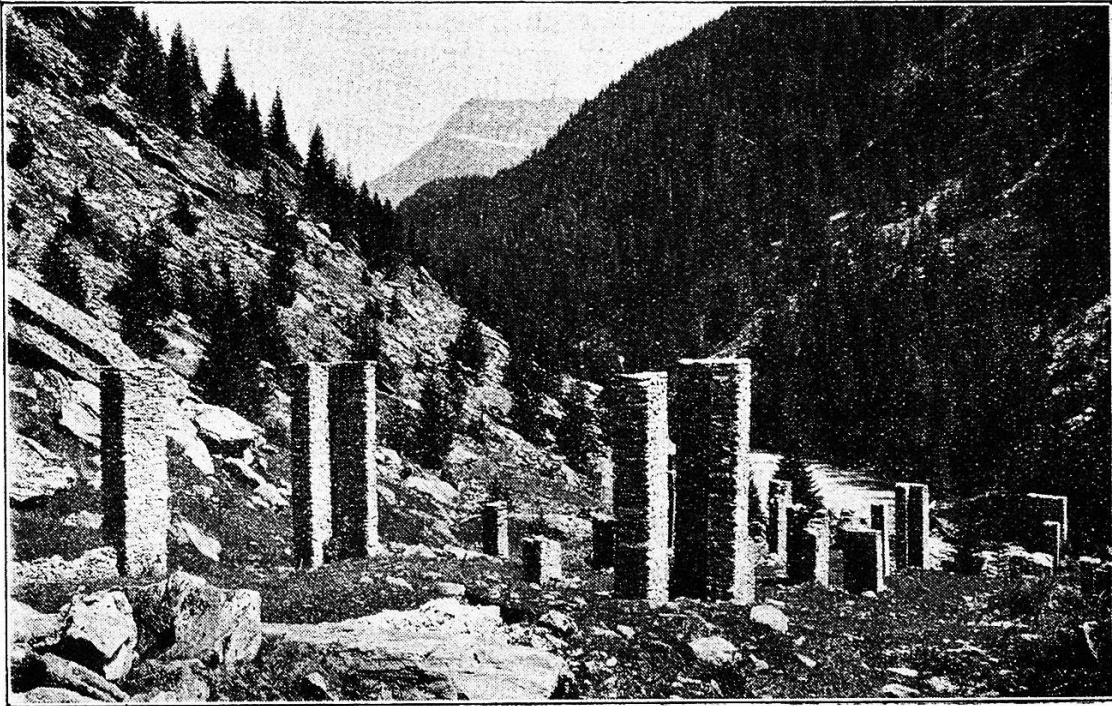
Ruinen der Eisen-Schmelze bei Inner-Ferrera 1480 im Ober-Val (Graubünden).

Heute aber sucht man vor allem neue Wege, man sucht neue Manieren, man sucht neue Technik, man sucht und sucht, und oft so sehr, daß es irgend