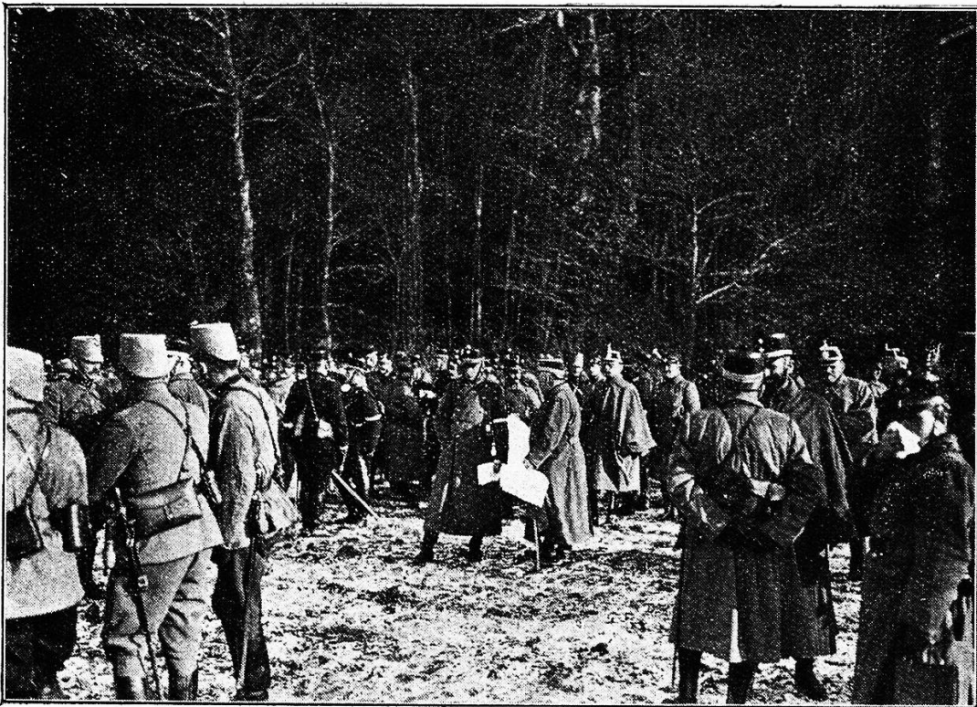
Bilder aus dem Grenzdienst. General Wille mit seinem Stab.

Im Gebiete der Sambre kam es zu den ersten kriegerischen Zusammenstößen. Napoleon erkannte den Fehler Wellingtons und Blüchers, daß sie die Vereinigung ihrer Heere nicht schnell genug vollzogen. Am 16. Juni stürzte er sich bei Ligny auf das Heer Blüchers, der im Vertrauen auf Wellingtons Beistand sich in den Kampf einließ, aber in furchtbar blutigem Ringen von der feindlichen Übermacht geschlagen wurde, da Wellington von einem französischen Korps bei Quatrebas am Wege nach Brüssel aufgehalten wurde. Für Blücher war der Tag von Ligny ein Tag bitterer schmerzlicher Erfahrung, seelischer wie leiblicher. Er selbst kam unter seinen zu Tode getroffenen Schimmel zu liegen, hilflos; daß er aus dem Kampfgewühl gerettet werden