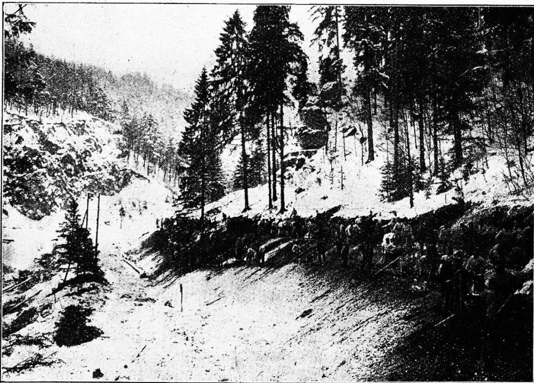
Wegverbesserung in der Schlucht der Pierre-Pertuis.

Im Gewühle des Kampfes gestaltet sich Napoleons persönliche Lage immer gefährlicher. Er sieht, daß seine bewährtesten Krieger dem feindlichen Ansturm nicht mehr stand zu halten vermögen, daß Fußvolk und Reiterei in ungeordneten Haufen gegen Rossomme zurückweichen, vom jauchzenden Feinde verfolgt. Ein Adjutant nach dem andern kommt mit der Meldung, alles sei verloren. Bleich, an diesem Tage überdies von einem schmerzhaften Uterleiden gepeinigt, richtet der Kaiser die Blicke auf die niederschmetternden Vorgänge um ihn. „Ich glaube, sie sind mitten unter uns“, sagt er zu einem der Generale seiner Umgebung, und einen Rat desselben in der verzweifeltsten Lage verwirft er mit der Erklärung: „Zu spät! Retten wir uns!“ Und während die Garde noch ihren heldischen Widerstand fortsetzt, bis sie endlich erschöpft die Waffen strecken muß, flieht er, wie von panischem Schrecken er-