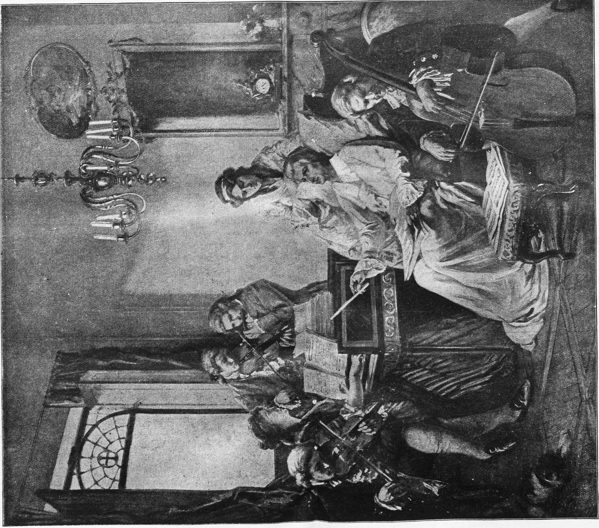
Mozart lässt sich kurz vor seinem Tode sein Requim vorspielen.