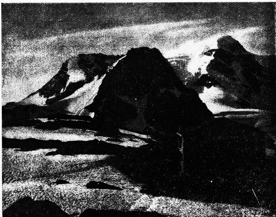
Diavolezza-Hütte (2549 M.), mit Biz Trobat und Biz Cambrena, Kt. Graubünden.

Mit Mühe hielten ihn die beiden Landsleute von diesem Plan ab. Das könnte schön heraus kommen, wenn sie den wütenden Lehrer so allein hinaus ziehen ließen. Sie kannten die schönen Sitten und Gebräuche des Landes. Der Lehrer wäre wohl einfach herausgeschmissen worden. Da mußte schon einer mitgehen. Das war ja schließlich ganz amüsant. So etwas erlebte