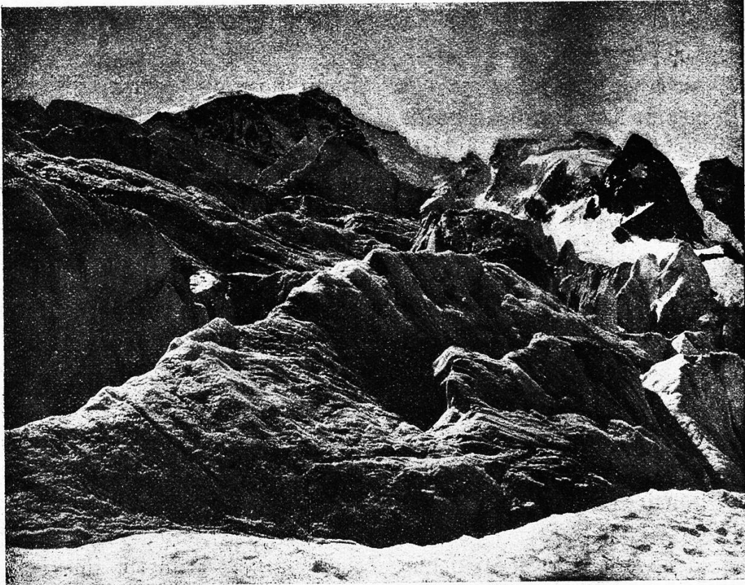
Tschierba-Gletscher mit Piz Bernina, Kt. Graubünden.

Unterdessen hatte seine Frau den Brief aufgehoben und gelesen. Für sie war dessen Inhalt nicht sehr wichtig, denn sie hatte sich weder mit der Hoffnung auf eine Erbschaft getragen, noch überhaupt an Geld gedacht. Der Verlust ihres Bruders war ihr nahe gegangen. Trotzdem hatte sie lächeln müssen, als ihr Mann die Erbschaft, die, wie er sagte, sicher da sein müsse, so heiß ersehnte. Nun war es also nichts damit. So stand es wenigstens in