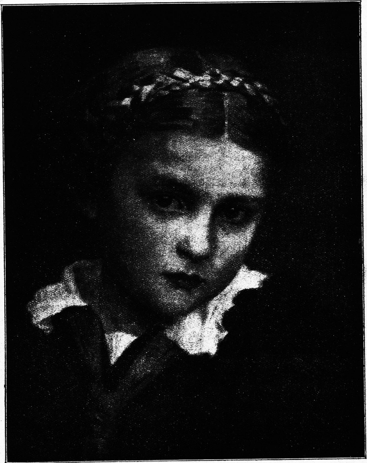
Kinderköpfchen. Gemälde von Prof. Ludwig von Langenmantel.