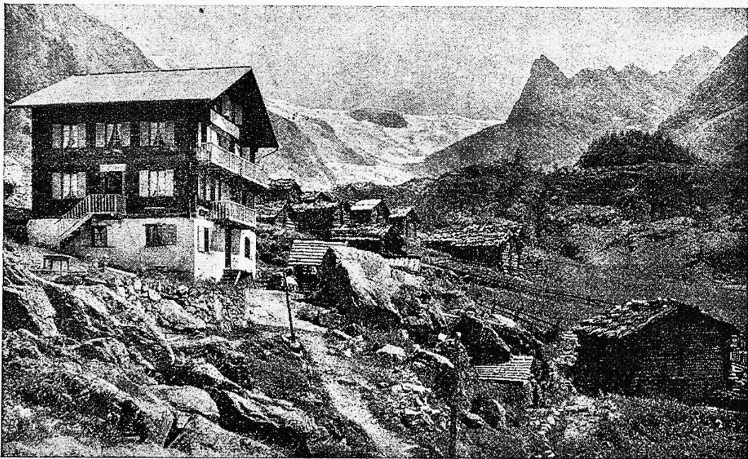
Ferpècle und der Mont Miné.

Am Kapellchen vorbei windet der Saumpfad sich erst durch wüstes Geröll, dann immer ansteigend durch Wald und duftende Wiesen. Unter dem rauschenden Dunkel der Tannen, um die Felsblöcke in den Alpweiden her schimmert's rot in tausend und abertausend Blüten und im Nu ist der schönste Alpenrosenstrauß am Stocke festgebunden. Und aus der Tiefe, aus dem Talhintergrund blitzt's in blendendem Weiß und zum immer wachsenden Ferpècle-Gletscher gesellt sich, durch den sagenumwobenen, dunkeln Mont Miné von ihm getrennt, ein zweiter Gletscher-Strom, der von der runden Schneekuppe der Tête-Blanche zu Tale steigt, und ist der Eisströme Bett geeint, so wächst's zu erstaunlicher Breite. Schutt und Geröll bezeichnen sein schmutziges Bett, der Gletscher selbst aber zeigt sich in seltener Reine.