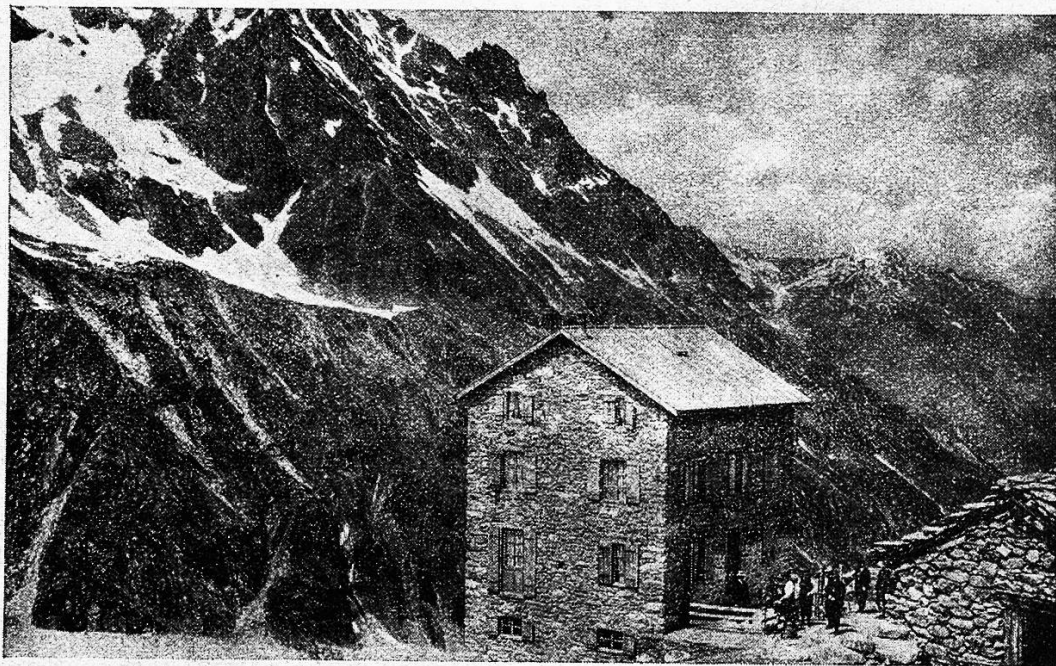
Hotel-Restaurant Bricolla, 2426 m.

Lange lagen wir hingestreckt auf grünem Rasenteppich, ganz nahe am Schnee, im strahlenden, wärmenden Sonnenschein und haben hinauf und hinab geschaut. Welch' riesige Schnee- und Eismassen liegen noch auf der Dent-Blanche. Nach Westen fällt sie zum Ferpècle-Gletscher sanfter ab; man sollte nicht meinen, daß sie gerade von dieser Seite her am schwierigsten zu erklettern sei: Von ihren Wänden donnern Lawinen zu Tal und Sturzbäche rauschen über Felsen. Aber auch aus der Tiefe rauscht's und braust's zu unserer stillen Höhe hinauf. Im Eisleib des Ferpècle-Gletschers ist's lebendig, und das Tosen der Gletscherbäche dringt bis an unser Ohr. Kühl weht der Wind von den schneeigen Kiesen über unsere Höhe und die tausend Blu-