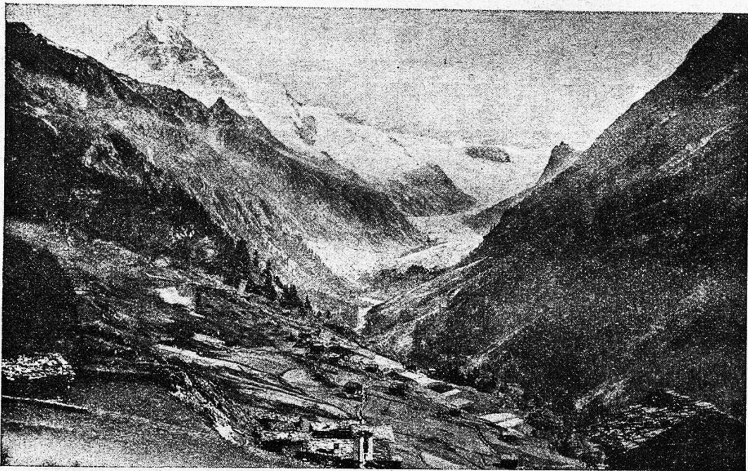
Das Tal von Ferpècle und die Dent-Blanche.

Aber endlich kam's doch und im heimeligen Hotel zur Dent-Blanche, im fröhlichen Geplauder an der wohlbesetzten Tafelrunde und im weichen, warmen Bett und gesunden, tiefen Schlaf erneut sich Körperkraft und Wanderlust, und früher als tags zuvor ging's diesen Morgen wieder die schnurgerade Straße auf Gaudères zu. Am Dorfbrunnen sind sie auch schon geschäftig, unter mächtigem Holzdach sprudelt das kalte Wasser in starkem Strahl in den geräumigen Trog und auf großen Steinplatten reiben und quetschen ihre Wäsche des Dörfchens geschwätzige Weiber.