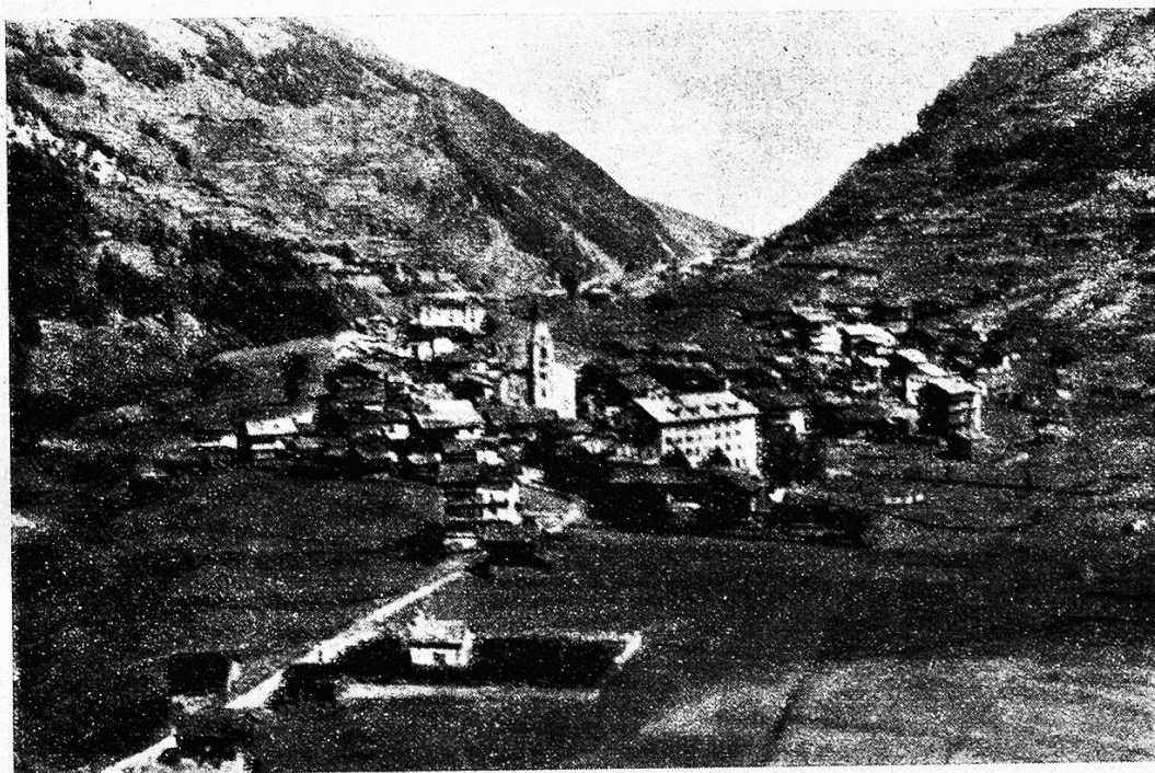
Ansicht von Eolena.

Was die andern Täler nicht bewahrt, im Gringertal ist's bis auf den heutigen Tag Sitte und Übung geblieben; sie tragen des Tales Tracht aus grobem, selbstgewobenem Tuch gefertigt, dem Stoff der Capuziner nicht unähnlich. — Ein Sonntag aber, da sie Männlein und Weiblein, Alt und Jung