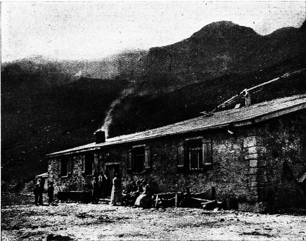
Auf Alp Malschül.

berner Faden durchzieht der Werdenberger Binnenkanal die weite, braune Fläche des schweizerischen Teiles der Talsohle. Noch harret hier ein weites Gebiet, ein einstiges Seegrundstück, der Schollenbearbeitung und der Befiedelung. Denn es ist die Entwässerung des alten Sumpfgebietes noch nicht gründlich durchgeführt, und noch halten sich die prächtigen, von Obstbaumkulturen dicht durchwirkten Dörfer ganz an den erhöhten Rand der Talsohle. Diese Siedelungsart war ehemals bedingt durch die starke Versumpfung des Talgrundes, und es meiden denn auch die alten Heerstraßen das offene Talgelände. Die neue Zeit mit ihren „Ameliorationsbestrebungen“ auf vielerlei Gebieten wird auch die Rheintalsole zu bevölkern vermögen. Drüben im Talgebiet des Liechtensteiner-Ländchens aber fehlen die Entwässerungskä-