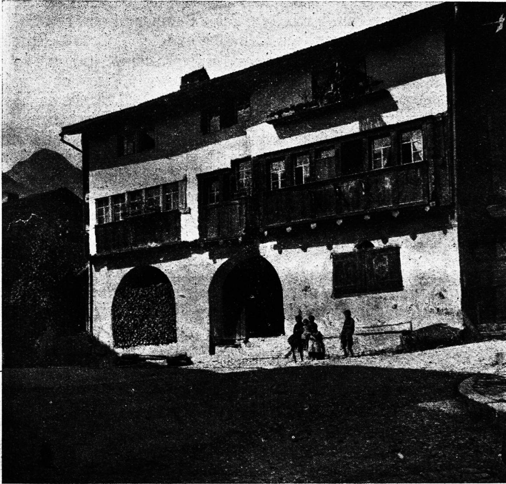
Ein Stück Werdenberg.

Vom Bahnhof Buchs leitet eine schnurgerade Straße ins stattliche Dorf, Hauptort des Bezirkes Werdenberg, hinein. Schöne, in modernem Baustil gehaltene Geschäftshäuser, die den breiten Verkehrsweg flankieren, lassen erkennen, daß der Bahnverkehr den kommerziellen Zweig des Wirtschaftslebens zu schöner Entwicklung gebracht hat. Erst dort, wo wir den westlichen Rand der Talsohle erreichen, betreten wir die alte Siedelung mit ihren aus