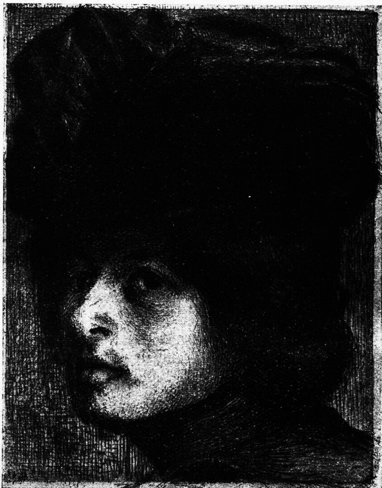
Radierung von Eduard Stiefel.

Ein „freies Leben“ führen die „Zigeuner“; nicht an Haus und Hof gefesselt, lassen sie ihren Wagen, der ihnen beides ersetzt, gerade da Halt machen, wo es ihnen gefällt, möglichst außer Sichtweite der h. Polizei. Wenn nicht in des Waldes düstern Gründen, so sind sie doch gern am Waldrand zu finden, von wo ihre Beutezüge in die Kartoffelfelder ausgehen. Mutter schält bereits eine Tracht von den schmachhaften Knollen, und die junge Frau schürt das Feuer unter dem Kochfessel, während die Männer faulenzten und