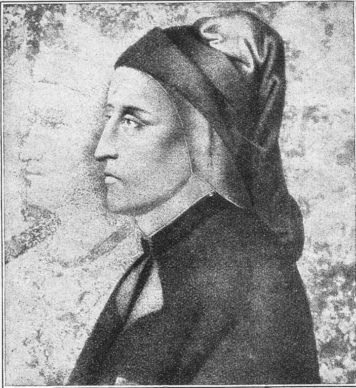
Bildnis Dantes, von Giotto.

pflasterten Platz von San Martino mit seinem steinernen Brunnen wuchs er, ein früh verwaistes Kind, auf. Dort ging er in die nahe Schule der Franziskaner, dort hörte er die Kirchenglocken läuten und betete an den Altären, hörte die tief in sein Gemüt sinkende, dröhnende Mahnung an das jüngste Gericht, an Hölle und Paradies, die so nahe schienen. Dort trug er seinen Liebestraum durch die lichtdurchfluteten Straßen, dort traf er seine ritterlichen jungen Dichtersfreunde, denen er Sonette und Ranzonen zuschickte. Und dort vernahm er den Donnerruf, daß Beatrice gestorben war, der die Stadt mit einem Schläge lichtlos und verödet machte.