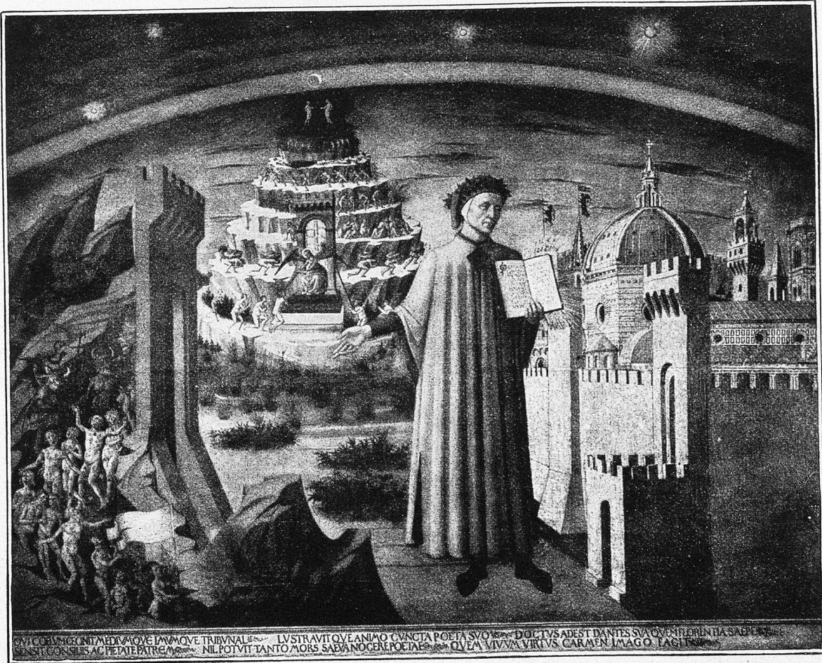
Dante und seine Dichtung. Gemälde von Michelino.