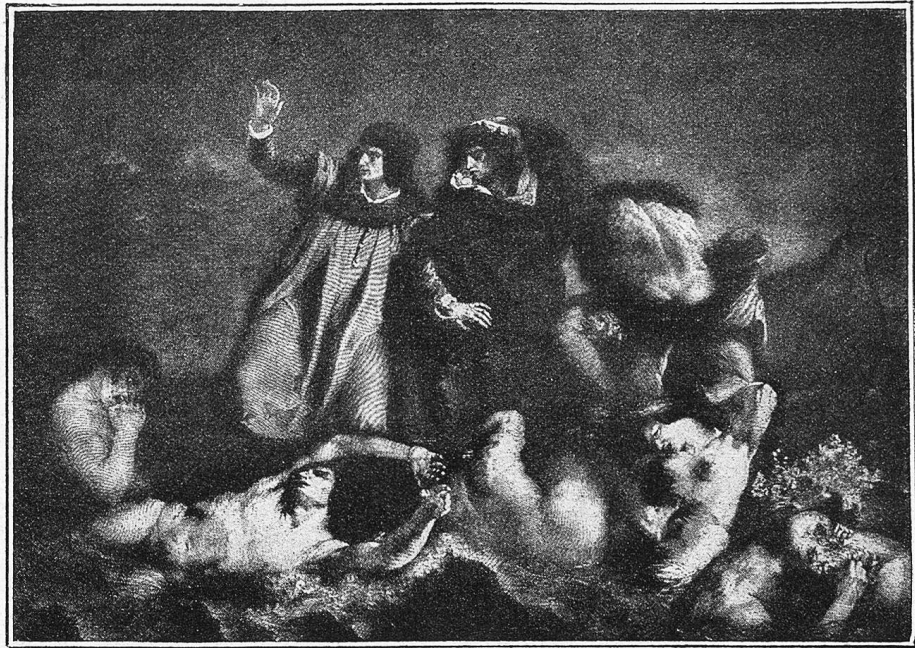
Phlegias fährt Dante und seinen Führer Virgil über den Styx. (Hölle 8. Gesang.) Nach einem Gemälde von E. Delacroix.