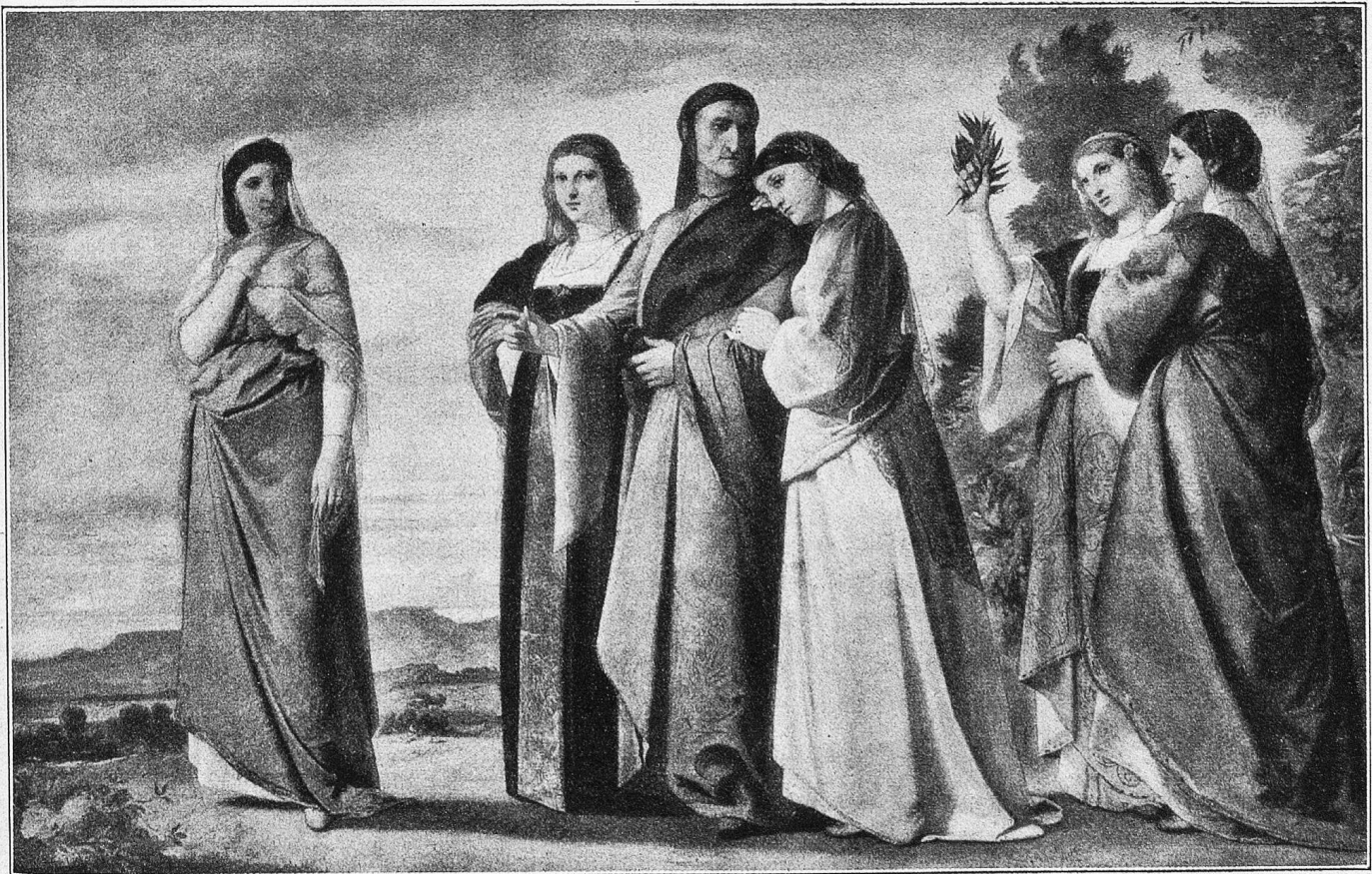
Dante, mit schönen Frauen in Ravenna wandelnd. Nach dem Gemälde von Anselm Feuerbach.