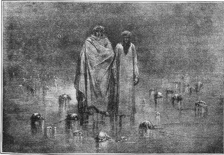
Dante und Virgil auf dem Eiszee, der die Seelen der Verräter einschließt. (Hölle 32. Gesang). Nach dem Holzschnitt von G. Doré.

erschien und ihm die Stelle zeigte, wo die Handschrift verborgen lag. Boccaccio hat dies vom Notar Giardini, dem Freund des Toten, der es miterlebt hat, erfahren. Nun erst lag das ganze Werk vor und begann auf die Menschheit durch die Jahrhunderte zu wirken.