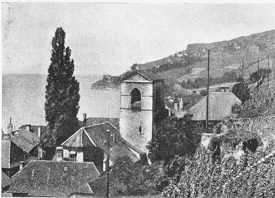
St. Saphorin (Waadt).

Längst schon hatte uns das Schiff an der Geburtsstätte der „Ormond“ vorübergetragen, seeabwärts, Lausanne zu. Was bei dieser Fahrt das Auge sah, war unbeschreiblich schön. Der mächtig sich aufbauende Berggrücken des Mont Pélérin begrenzt den Blick nach Norden. Unten, vom Seeufer an Rebberg an Rebberg, durch Mauern