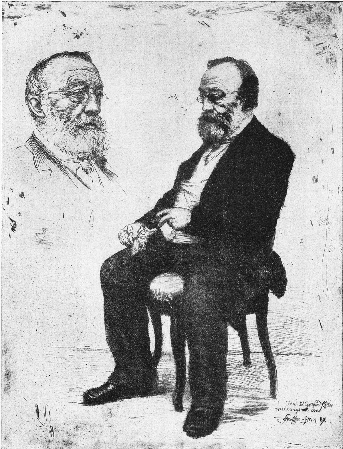
Gottfried Keller von Karl Stauffer (Radierung).