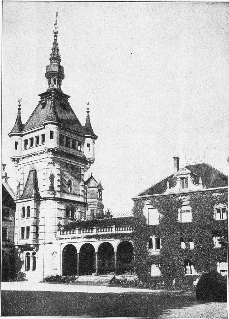
Im Schloßhof von Castell.