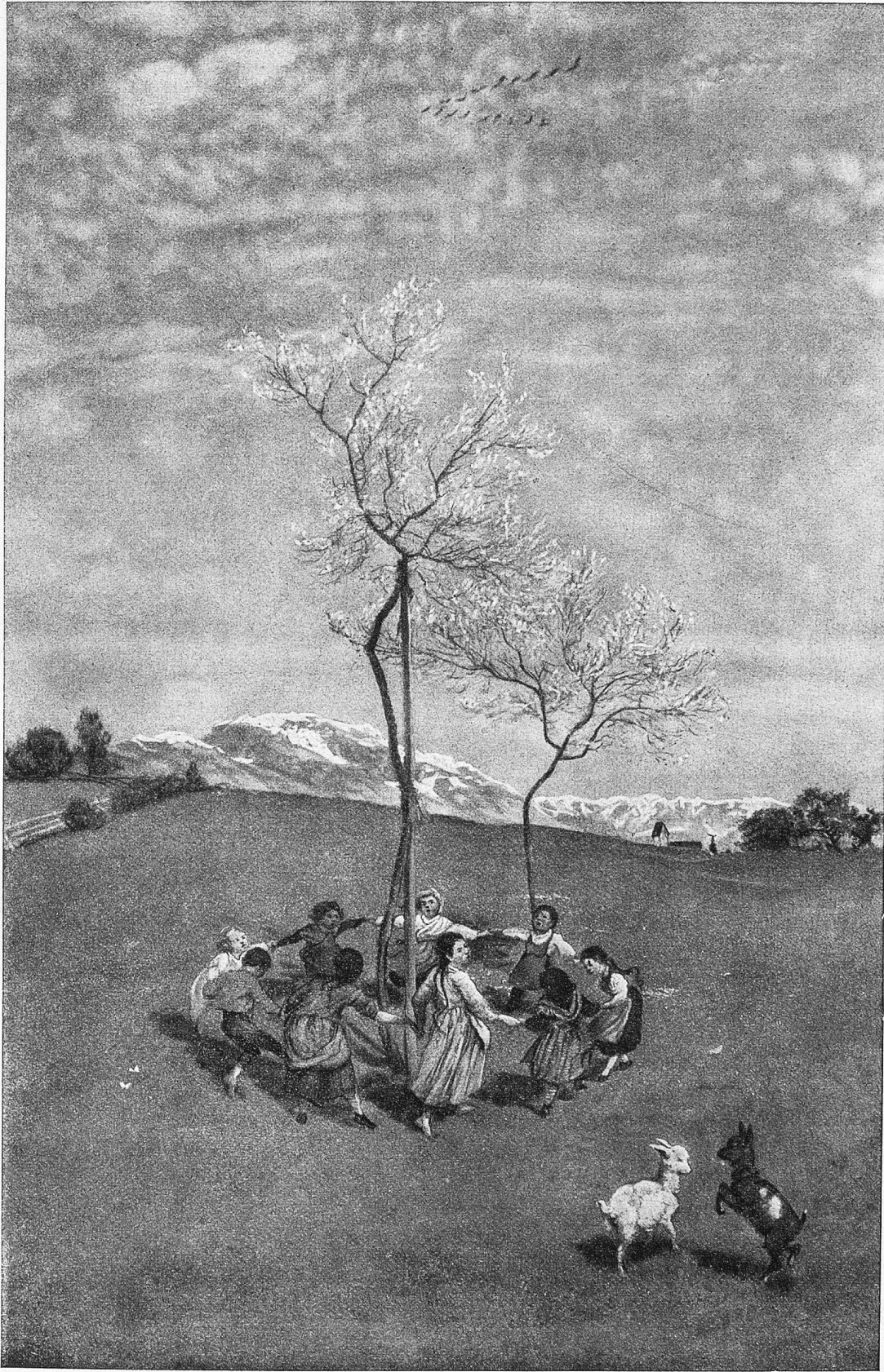
Hans Thoma: Frühlingsreigen.