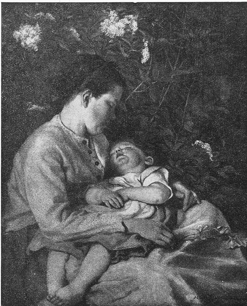
Hans Thoma: Mutter und Kind.

Die Scharen des Volkes folgten dem Zug. Als der Bräutigam die Schwelle der Kirche betrat, schwieg die Musik. Ein paar Duzend Pi-