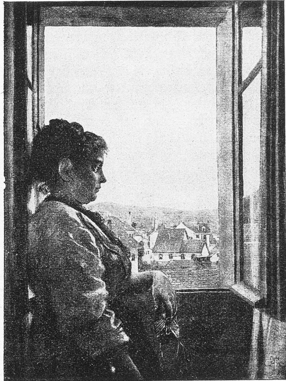
Hans Thoma: Am Fenster.

„Warum hat denn die Kunst so viel Bedeu-