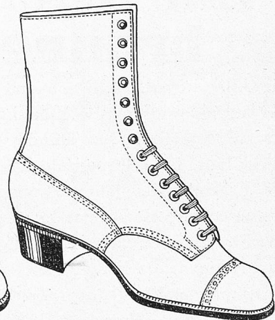
Damen-Schnürstiefel aus starkem Boxleder Paar 24 85