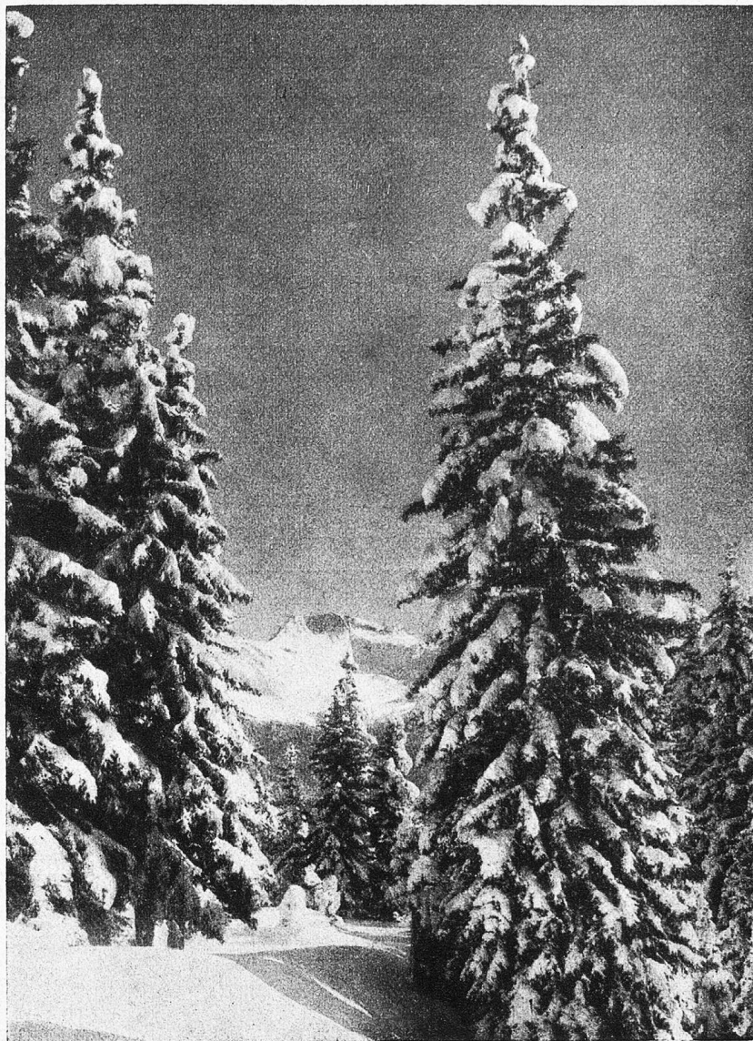
Im Mühleboden bei Arosa.

Ein Prachtwetter sondergleichen ist eingetreten. Gleißender Sonnenschein bei klarem Himmel und fast ununterbrochener Windstille wird nur ab und zu von kurzem Schneeflockenwirbel abgelöst, der sich pulverig über die alte Schneedecke legt. So ist die ganze wundervolle Gebirgslandschaft zum richtigen Terrain für den Skilauf geworden. Einheimische und Fremde, welche letztere die Hotels und Pensionen immer mehr füllen, tummeln sich auf den Schneeschuhen längs der Schneefelder des Tschuggen, des Hörnli, Brüggerhorns u. s. w.; drei Skihütten, die Ramoz-, Hörnli- und Brüggerhornhütte dienen als bequeme Höhenstandorte für weitere Skitouren. Aber selbst im Weichbilde des Ortes, dessen unebenes Relief sowohl auf der vom Bahnhof nach dem Schwelli- und Alplisee verlaufenden Hauptstraße, als auf zahllosen Nebenwegen von ihr nach aufwärts (Alpen Prättschli und Maran) und abwärts nach dem Untersee und der wildromantischen Schlucht der rauschenden Plessur von Skibeflissenen und Schlittlern, männlichen und weiblichen Geschlechts bevölkert ist, blüht alle Art des Wintervergnügens. Menthaben ertönt das lustige Geklingel der Pferdeschlitten, denn aller Verkehr, die Luxus- und Geschäftsfahrt wickelt sich auf ihnen ab. Selbst der Bäckerjunge sitzt stolz auf einem kleinen, nach arktischer Weise von einem fröhlich bellenden Hund gezogenen Schlitten, wenn er früh