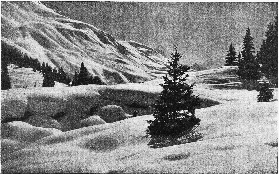
Stigebiet im Mühleboden bei Arosa.