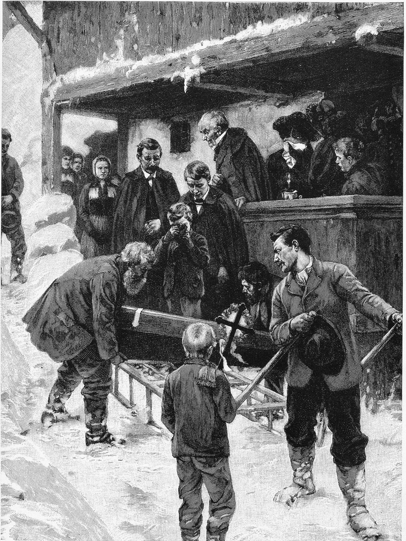
Begräbnis im Gebirge.