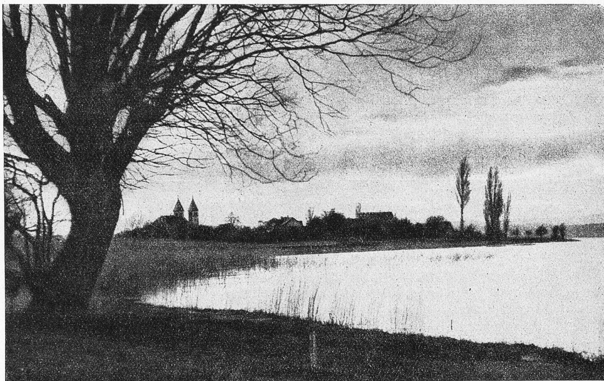
13. Blick auf Niedertzell. Bodenseestimmung.

kann seine zwanzig Personen aufnehmen. Auf diese Weise wird der Anschluß an die meisten Züge nach Konstanz wie nach Radolfzell-Singen hergestellt. Nur zehn Minuten dauert die Überfahrt, und doch wie viel Köstliches vermag sie uns zu bieten. Steht die Sonne hoch, dringen ihre Strahlen tief in die Flut, so daß der Grund grüngoldig leuchtet; der sanfte Wellenschlag hat dort seine Linien im Sande nachgebildet und magisch senden sie den Widerschein des Tagesgestirns in dein entzücktes Auge. Eilig fliehen Fische über den hellen Grund, und