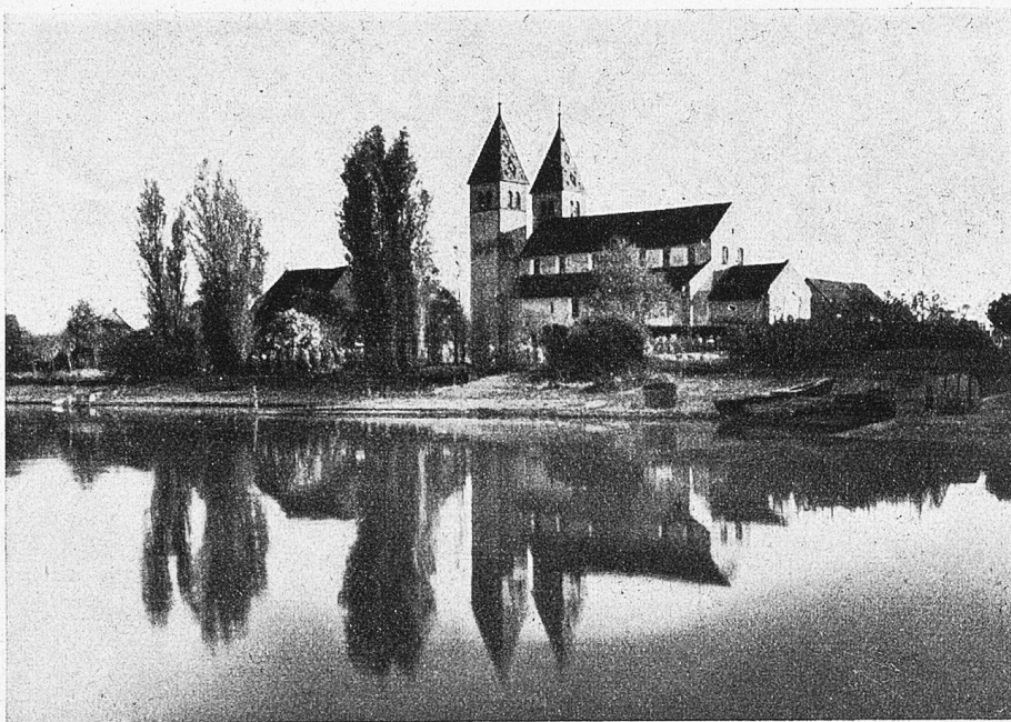
11. S. Peter und Paul, Niedertzell.

kenntnisses. Von größter Wichtigkeit ist jedoch die Ausschmückung des Chors. Da erblickst du eine Doppelreihe feierlicher Gestalten: unten 10 Propheten stehend, darüber 10 Apostel sitzend und in der Halbkugel in der Mitte den thronenden Christus, in der Linken das Evangelienbuch haltend, die Rechte segnend erhoben, die ganze Figur umschlossen von dem mandelförmigen Glorienschein, der Mandorla; zur