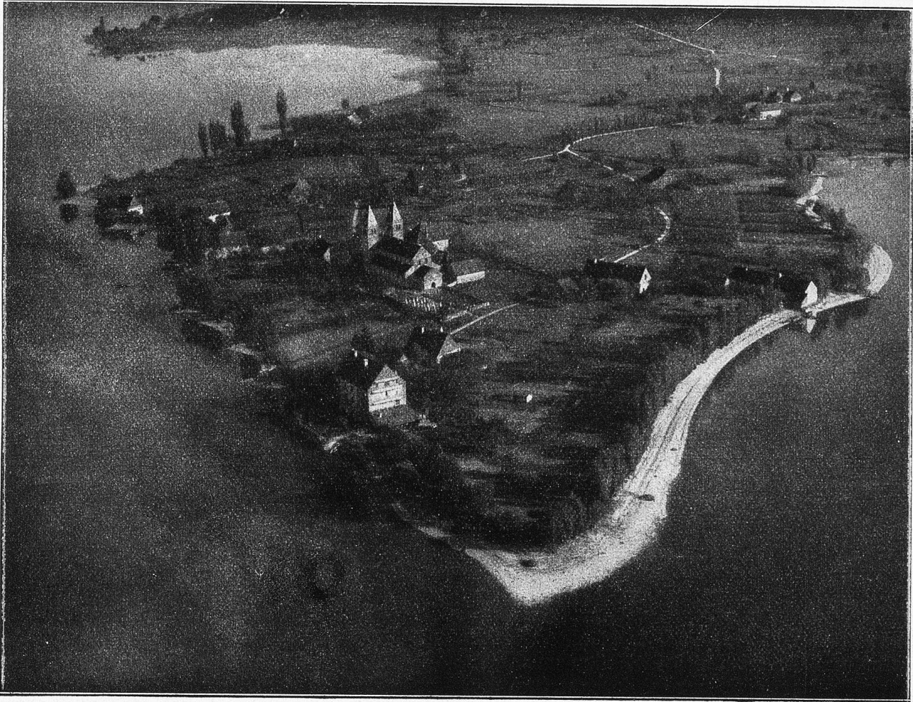
10. Nordwestspitze der Insel. Niederzell mit S. Peter und Paul und Schlößchen Windegg.

turm von Radolfszell winkt herüber, Moengals Revier, und in der Ferne grüßt der Hohentwiel, wo die Herzogin Hadwig und Ekkehard den Virgilius studierten. Im Geiste siehst du den Weg wieder dem See entsteigen, der Kämmerer Spazzo kommt auf seinem Streitroß Fallada hochtrabend einhergeritten, denn „den