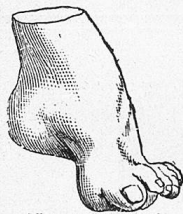
Nur nach Maß.

von Knick-, Platt- und Spreizfüßen, sowie verdorbenen und strüpierten Füßen. - Einlagen gegen Knickung oder Senkung des Fußgewölbes nach Maß und ärztlicher Vorschrift. - Sandalenapparate für große Beinverkürzung, Reitstiefel, Sportschuhe,