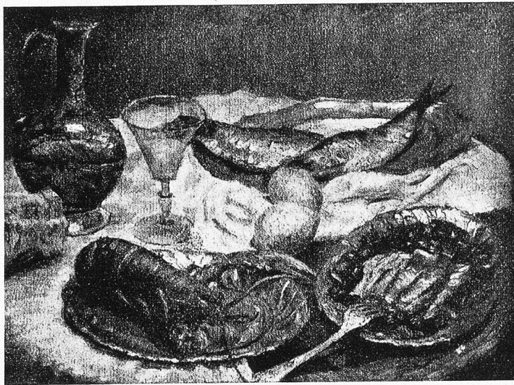
L. C. Breslau: Stilleben (1922).