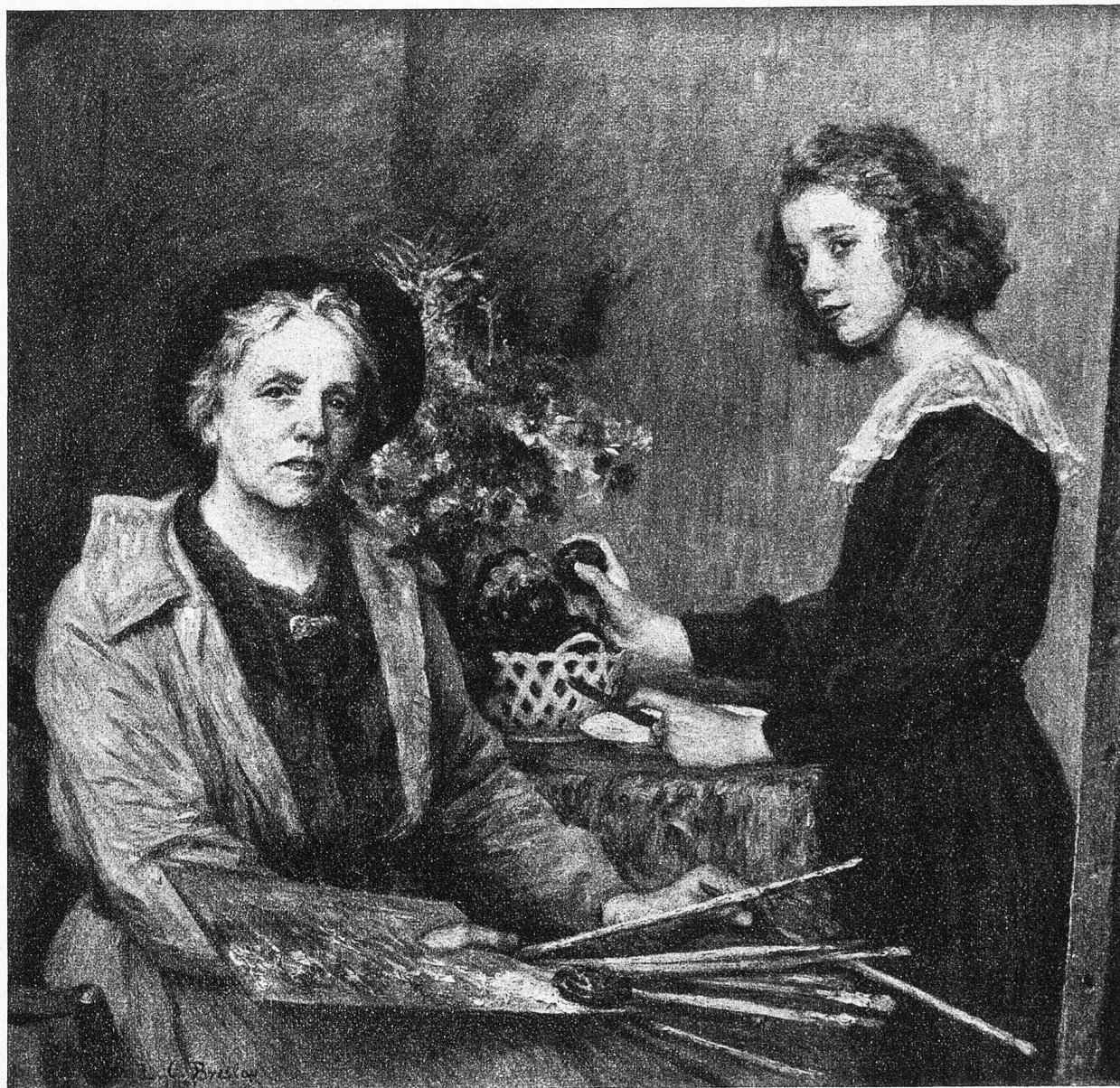
L. C. Breslau: Die Künstlerin und ihr Modell (1919).

sein kann. So auch Raffaelli. Er war es, der mich bei den Kunstliebhabern in Paris einführte. Und dann kannte ich Degas. Er war bewundert und gefürchtet nicht nur um seiner unvergleichlichen Kunst willen, sondern auch wegen der Sicherheit, mit der er immer wahr