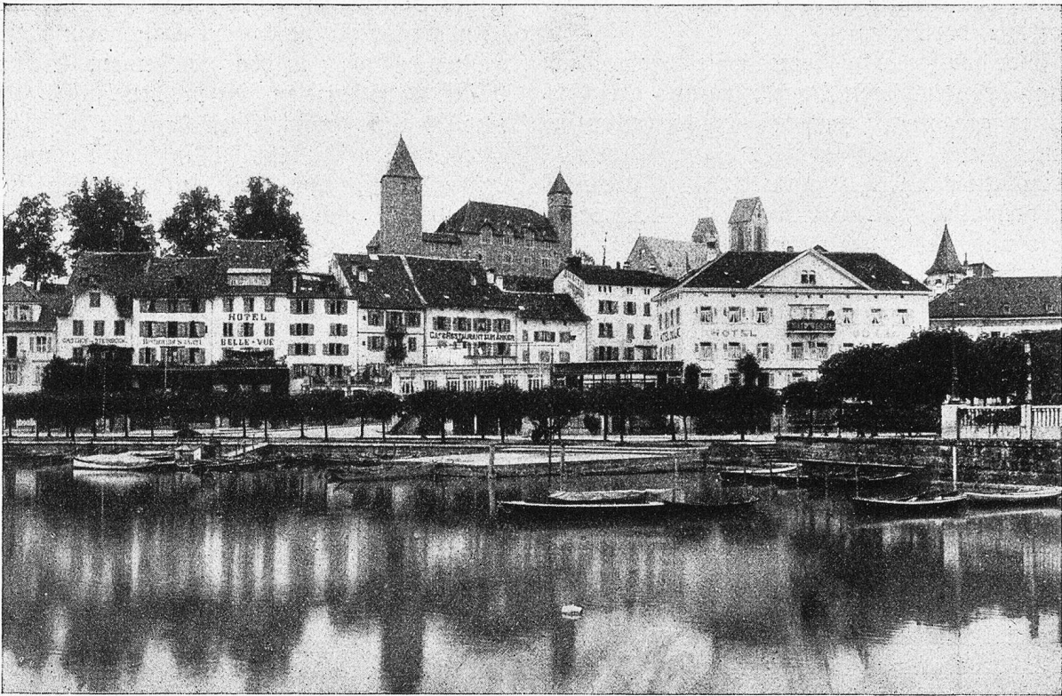
Napperswil vom Hafen aus. (Burg, Pfarrkirche, Mufeggturn.)