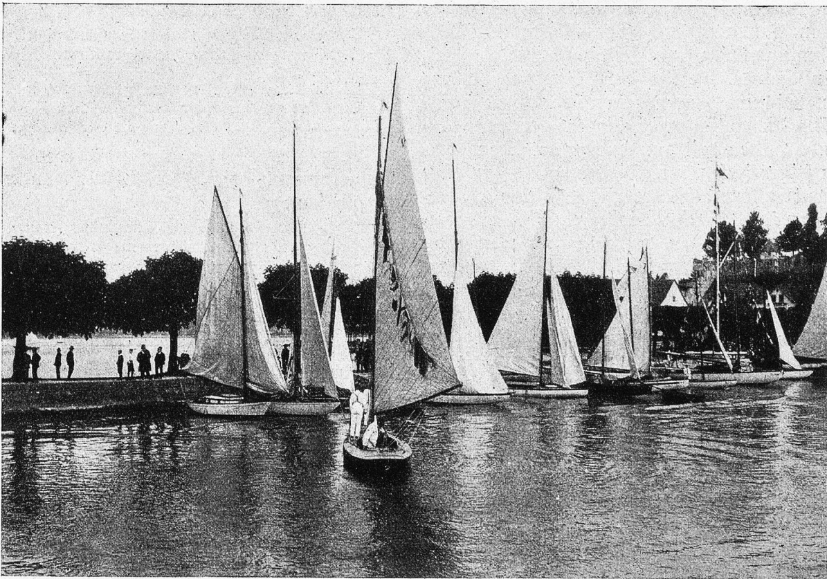
Napperswil. Segel- und Gondelhafen. Landungsquai.