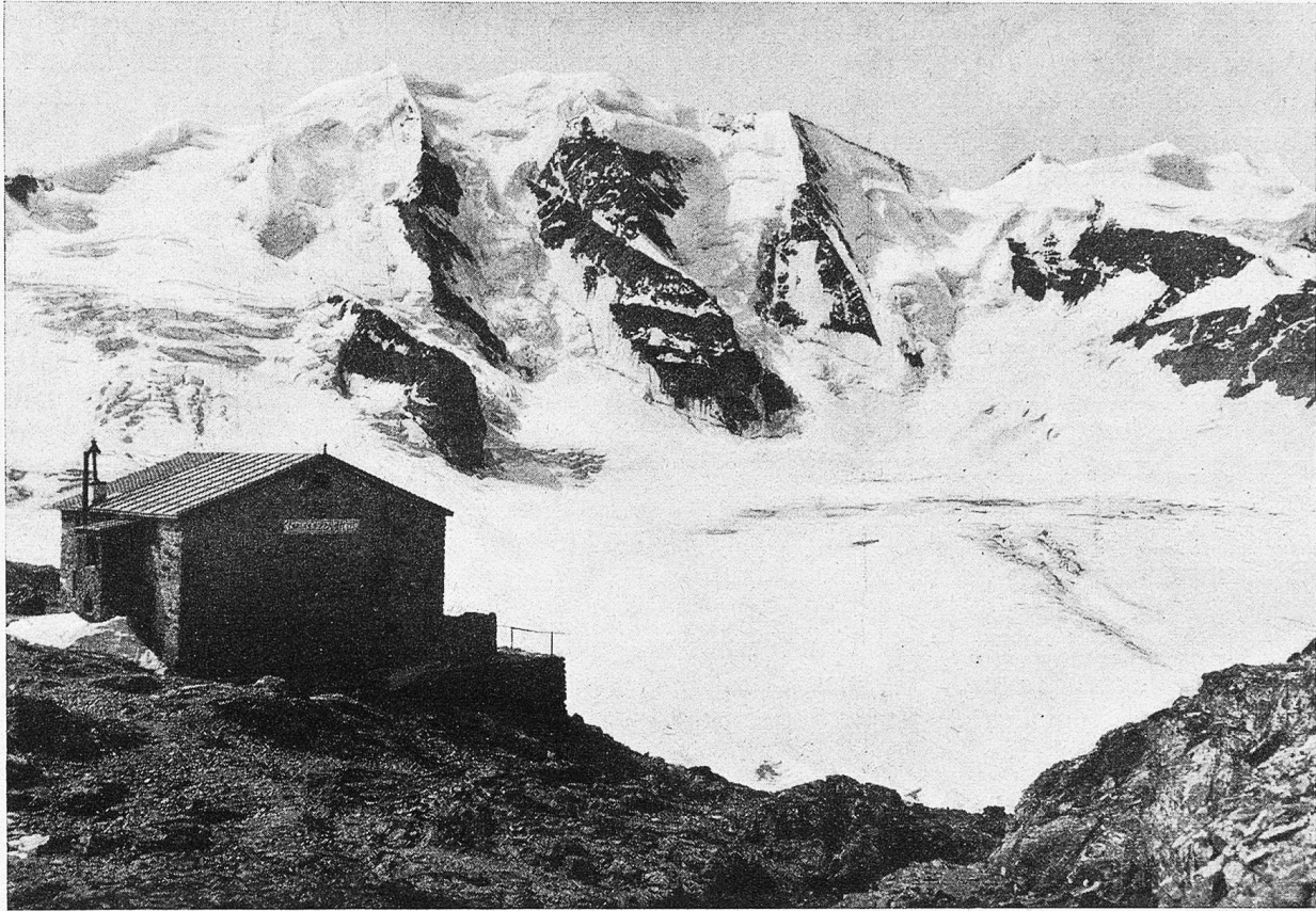
Die Diavolezzahütte mit Piz Palü (3912 m) Ausgangspunkt zur Besteigung des Piz Palü und Traversierung des Persgletschers zur Bobalhütte. Großartige Ansicht des Berninamassivs. Ober-Engadin.