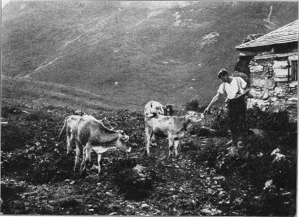
Auf der Baumgartenalp.