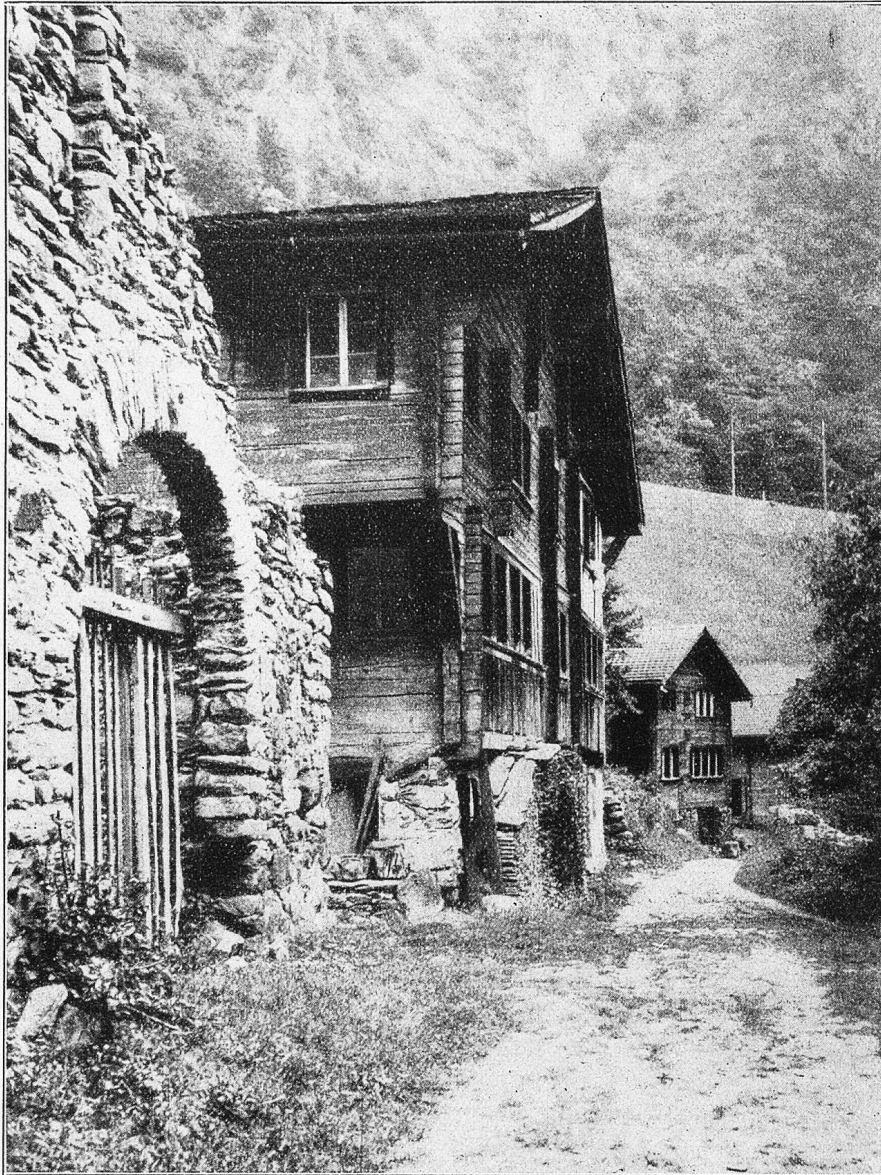
An der alten Gotthardstraße in Silenen-Amsteg (Kanton Uri). Links Tor einer ehemaligen „Susten“.

Der Schatten der westlichen Berghalde breitete sich über Mauer und Bank. Draußen auf dem See jedoch und am jenseitigen Ufer lag noch die helle Sonne, entzündete Fenster und brachte Kirchturmkreuze und Stangenspitzen zum Blitzen und Sprühen. Das Wasser war von Barken und kleinen Dampfern belebt. Weiße Segel, denen der Wind fehlte, standen reglos über dem tiefblauen Spiegel, der ihr Abbild klar wie sie selbst zurückwarf. Wie das Gefroße eines Ameisenhaufens flimmerte das Leben der Stadt herüber, und man sah ferne die vielen Sonntagsleute wandern und die Straßenbahnwagen hin und wieder gleiten. Manchmal