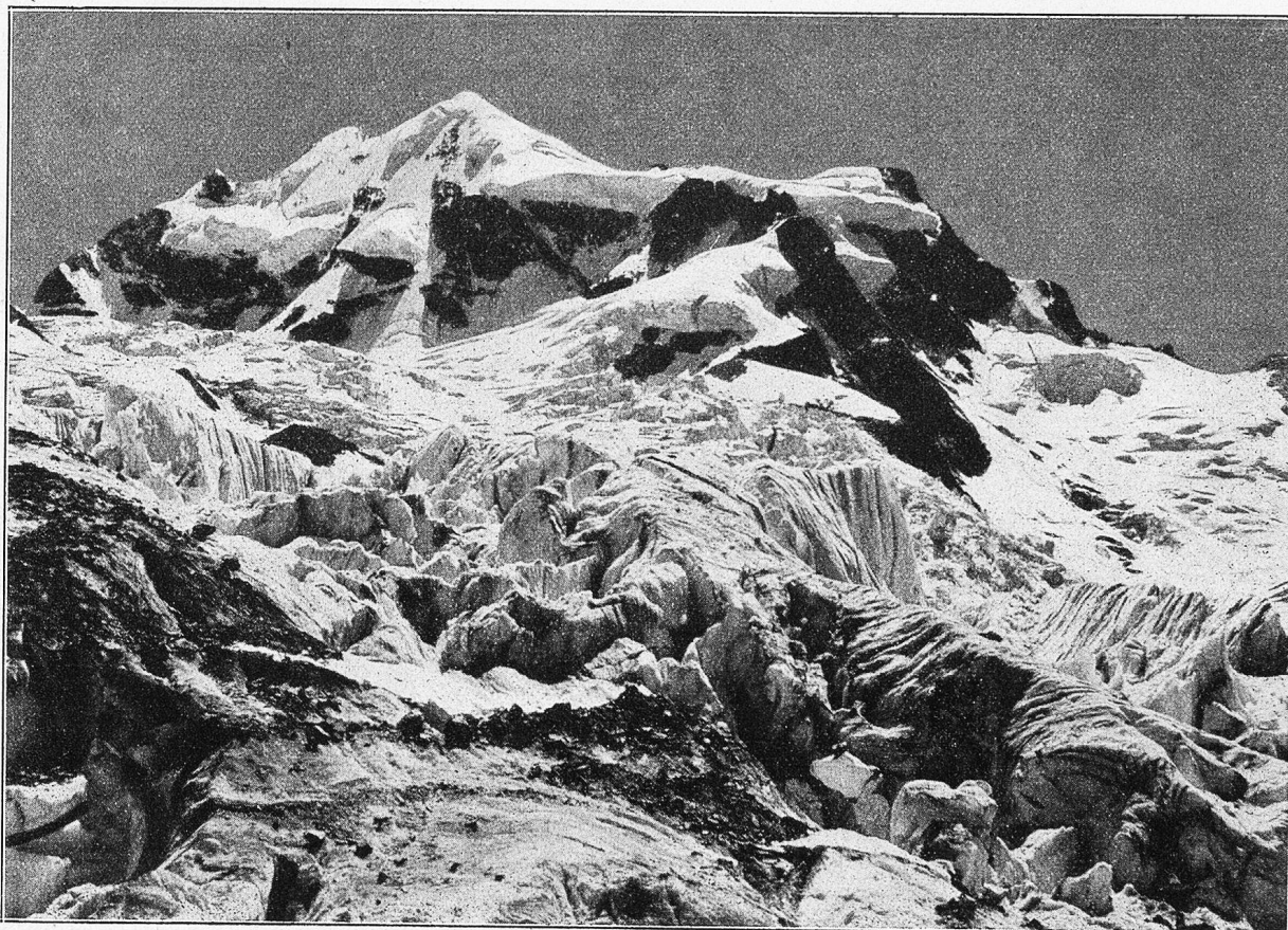
Am Tschierbagletscher, hinten Biz Rosseg (Ober-Engadin).

Kurz bevor es auch für ihn Zeit geworden wäre, sich auf seiner Schreibstube zu melden, trat die Lucretia Blank aus ihrer Tür. Sie erblickte ihn sogleich und kam auf ihn zu. Sie sah ihn scharf, dann erschreckt, dann mit Tränen in den Augen an.