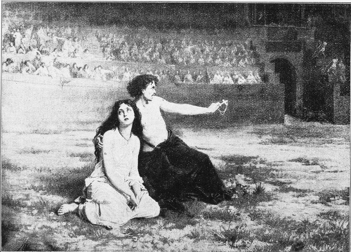
Zum Tode verurteilte Christen in der Arena.