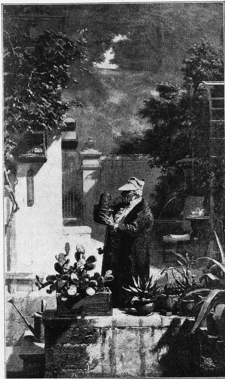
Karl Spitzweg, Der Kaktusfreund.

Nein, nein, nein, er würde nicht weichen. Er wollte keine Schwäche und Müdigkeit kennen, bis der Tod selbst ihm den Bogen aus der Hand nahm.