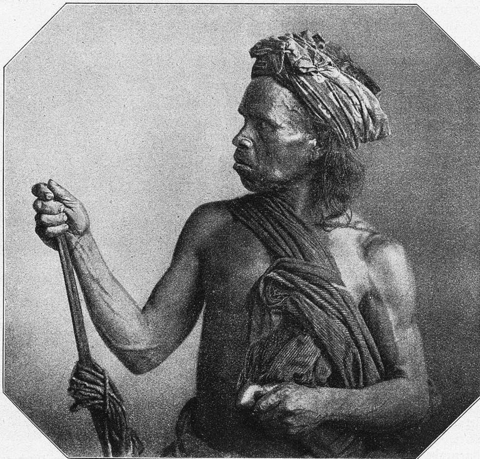
Karobataker, der noch Kannibale war, von der Karohochebene auf Sumatra.

Während diese drei Tiergattungen dem Menschen in jedem sumatranischen Hause be-