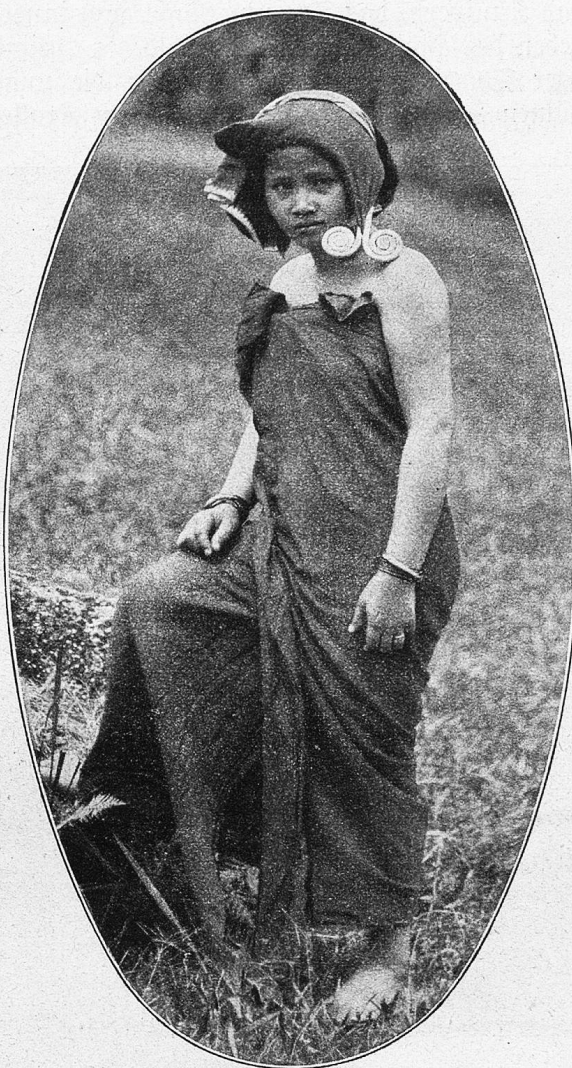
Batakerfrau von Sumatra in ihrer seit Jahrhunderten unveränderten Tracht mit schwerem silbernem Ohrschmuck, der den Reichtum des Ehemanns verkündet.

binson ist installiert, wohnlich eingerichtet, wie es sich für einen Urwaldbezwinger von selbst versteht, der mit Absicht und Wonne dem heimatlichen Luxus entflohen ist. Näher zur Na-