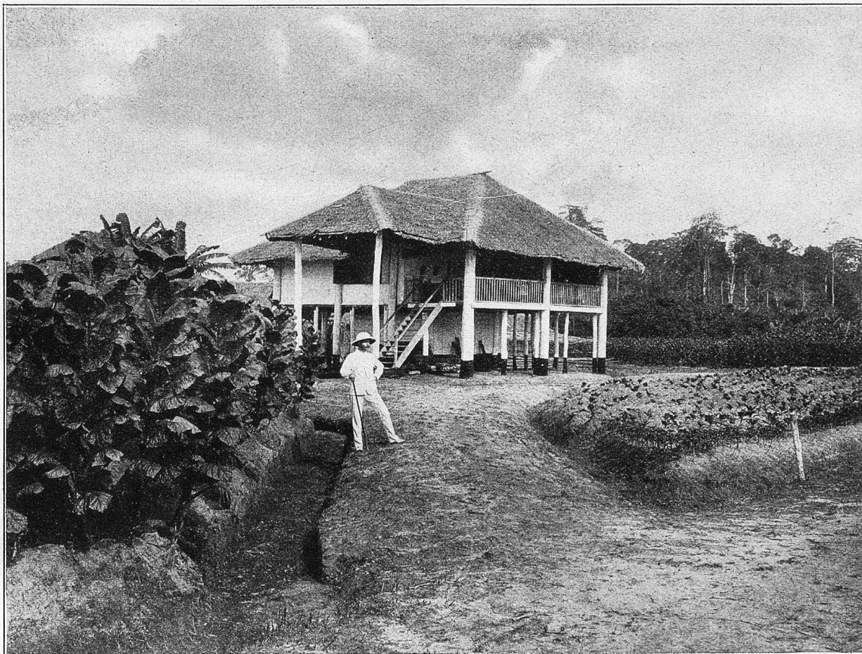
Assistentenhaus in Padong-Bedogei.

der Speichel des Tieres giftig sei und, in menschliche Speise oder in den Trank gemischt, einen Hautausschlag hervorrufe. Die Giftmischer brauchten ihn deshalb, um gegen Bezahlung gefährliche Nebenbuhlerinnen um ihre Schönheit zu bringen.