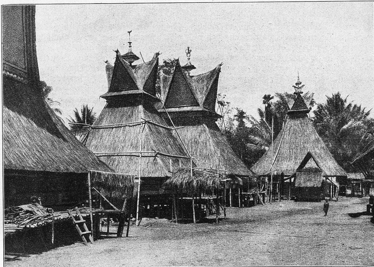
Wohnhäuser eines Batakerdorfes auf der Karohoebene von Sumatra.

rung angeboten, daß die zum Sprechen nötige Operation, das Schlißen der Zunge und ihr Bestreichen mit einem goldenen Ringe bereits erfolgt sei, also der Kunst des Vogels nichts mehr im Wege stehe. Was es mit dieser Vor- bereitung auf sich hat, weiß ich nicht zu sagen; nie habe ich einer solchen Operation beigewohnt und kenne den Handelsgeist der Malaien zur