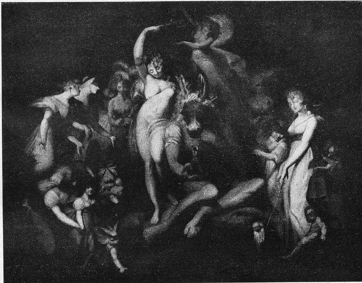
. Titania und Bettel mit dem Geselzkopf. National-Gallery, London.

Graf und Nikolaus Manuel über Füssli zu Hodler läuft. Am reifsten ist Füssli in seinen Zeichnungen und Aquarellen, die an und für sich ein bedeutendes Lebenswerk darstellen; viele seiner Bilder sind in fataler Weise nachgedunkelt. Selbst als Sechziger schien er noch unerföpflich zu sein; 1801 erschienen seine Vorlesungen über Malerei und es beschäftigten den Siebziger noch große Themen aus dem Nibelungenlied. Die Leidenschaftlichkeit seines Her-