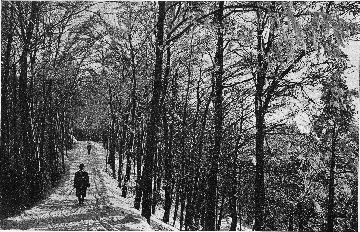
Gratweg bei der Annaburg zur Winterszeit.

Etwas nördlich von der Falletsche wird in zwei Gruben, von denen die eine sich am Weg