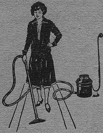
Fr. 210.— komplett.

Effektive Staubbeseitigung mit dem modernen Kesselapparat