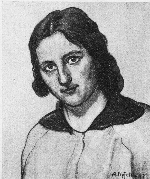
Damenporträt. Gemälde von Albert Nyfeler.

schlechterdings vollendet. Über die frappante Ähnlichkeit hinaus steigert er die Persönlichkeit zum Typus. Das Woher und Wohin spricht aus allen Gesichtern, man braucht nicht erst danach zu fragen. Hier dieser schlaueäugige Bursche mit den Lachrunzeln ist der „Spaßvogel“. „Der Präfekt Roth“ enthüllt sich in Blick und Miene