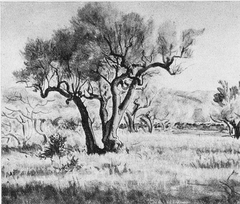
Olivenbaum. Gemälde von Albert Nyfeler.

ler. Er läßt ihm beim Auslesen der Motive freie Wahl und fördert ihn auch sonst mit seinen besten Kräften. Als Malergeselle wandert Nyfeler im Frühjahr 1903 nach Brienz. Er kommt mit den dortigen Künstlern in Verbindung und erfährt mancherlei Anregung durch sie. In den Mittagspausen und Feierabendstunden eilt er an den See und malt Aquarelle. Er hat es darin schon zu einer hübschen Fertigkeit gebracht und manches feine Bildchen gelingt, das sich auch heute noch sehen lassen darf. Im Herbst muß er zur Rekrutenschule einrücken. Noch während der Dienstzeit sichert er sich eine Stelle in Basel. Er besucht die Abendkurse der Gewerbeschule und erhält durch Vermittlung seines Zeichnungslehrers Wagen vom Staate Bern ein Stipendium. „In Anbetracht der Verdienste um die Ausmalung des Basler Rathauses“ spricht ihm