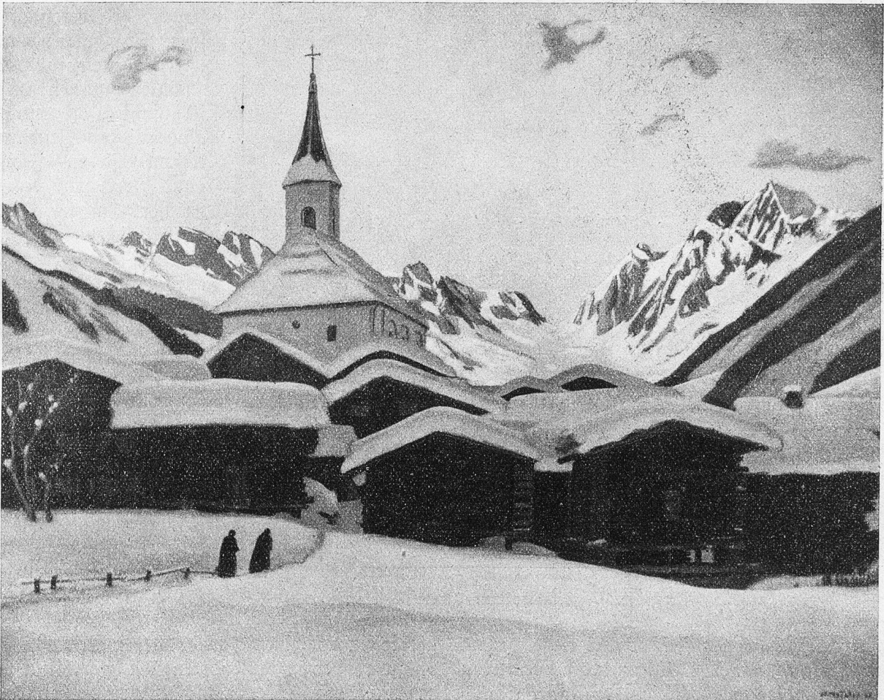
Rippel. Gemälde von Albert Myfeler.

Künstlerin von der seltenen Begabung, aber auch von der Dürftigkeit des jungen Malers gehört. Sie rufen ihn. Er legt seinen Adelsbrief, die Bilder und Zeichnungen vor. Die beiden sind ergriffen von der Kraft und Reinheit des Ausdrucks, die sich in den Werken des jungen Künstlers offenbaren. Eine Einladung wird geschrieben. Im eigenen Marmorfaal hängen sie seine Bilder und Zeichnungen auf, be-