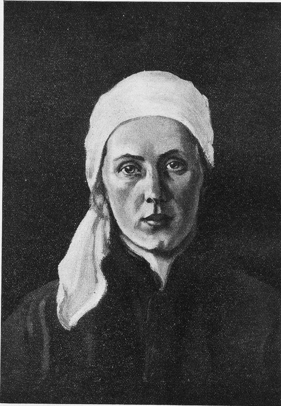
Lydia (die Gattin des Künstlers). Gemälde von Albert Nyfeler.

glaubt. Zu oft hat er's erfahren, als daß er daran zweifeln könnte.