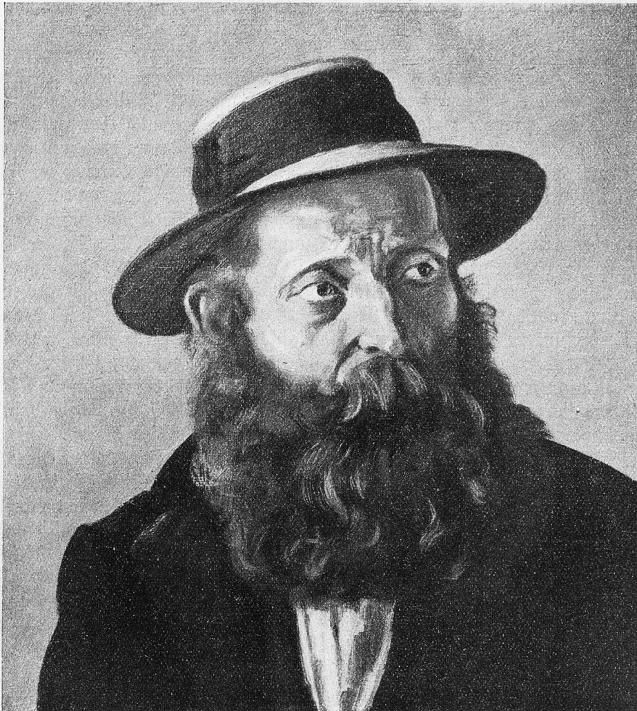
„Blasius.“ Gemälde von Albert Nyfeler.

Werkstattwände im freien Entfalten gehemmt. Wir dürfen von ihm erwarten, daß er einst noch in traumtiefen Symbolen zu uns sprechen wird von der rätselvollen und unerforschlich-schönen Sibylle Welt.