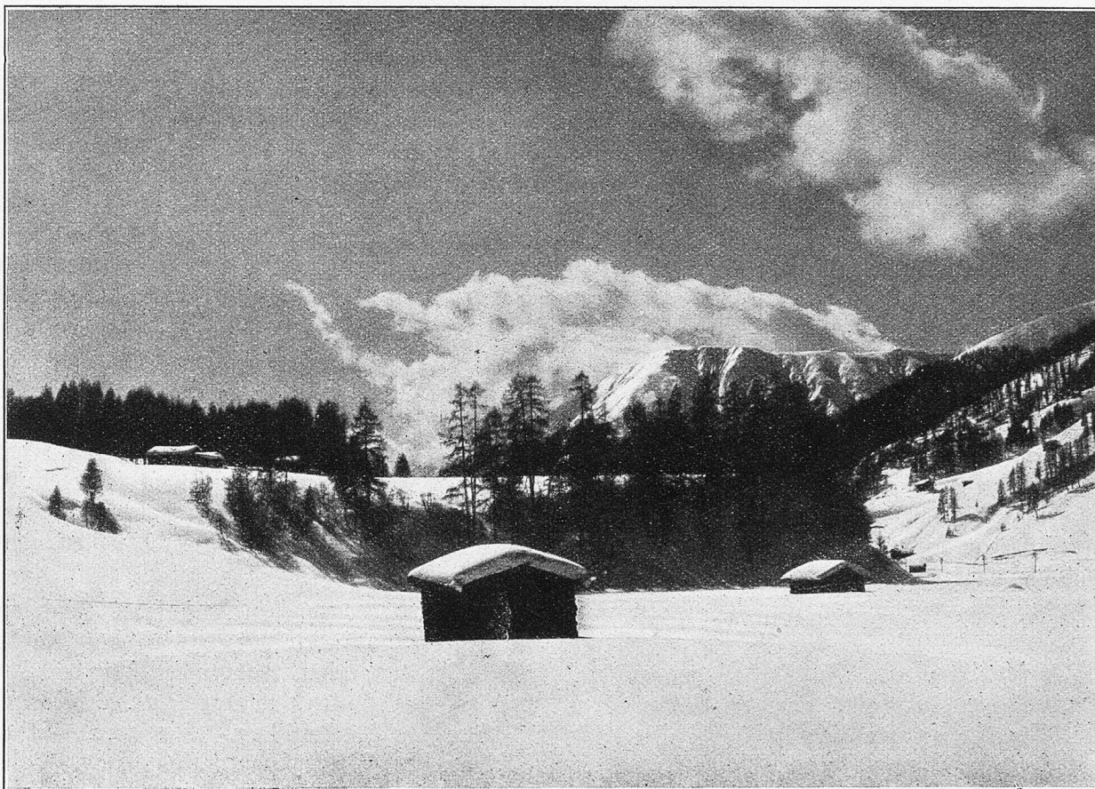
Winterbild am Wildboden.

Ist der Beruf einmal erwählt, dann helfen unbedachte Worte gar oft, das gute Verhältnis zwischen Lehrling und Meister zu lockern. Wie leicht wird die Klage über zu strenge Meisterschaft, zu lange Arbeitszeit usw.