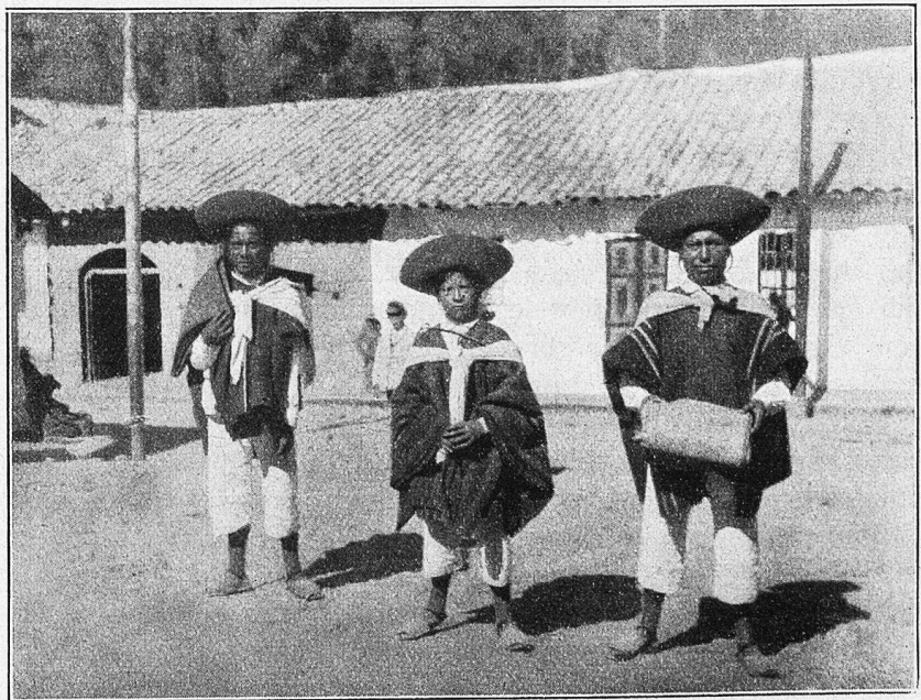
Quito. Indianische Tuchhändler aus dem Norden mit ihren selbstverfertigten Stoffen.

wecken sie einen fremdartigen, um nicht zu sagen unheimlichen Eindruck. Die dunkeln Wolken und die Gewitterschwüle, die den ganzen Nachmittag über der Landschaft lagerten, und das mir unverständliche Ketschuageschwätz der Indianer im Wageninnern waren keineswegs dazu angetan, diesen Eindruck abzuschwächen. So war ich denn froh, als der Zug gegen fünf Uhr abends in den primitiven Bahnhof der ecuadorianischen Hauptstadt einfuhr. Da die Station selbst am Südrande der Stadt gelegen ist, mietete ich einen indianischen Träger, der mein umfangreiches Handgepäck, unter dem sich auch das Zelt und die ganze Bergausrüstung befand, nach dem Hotel schaffen sollte. Mit einem der modern, europäisch anmutenden Wagen der elektrischen Straßenbahn fuhren wir nach dem Zentrum der Stadt und standen bald vor dem Hotel Ecuador, das mir von einem Bekannten in Riobamba besonders empfohlen worden war. Der Wirt, ein älterer Junggeselle, der nebenbei auch noch den Rechtsanwaltsberuf ausübt, empfing uns sehr freundlich und bot mir für zwei Sucre, d. h. einen halben Dollar, zwei große nach der Straße gehende Zimmer im ersten Stock an. Das Haus selbst besitzt einen geräumigen, jedoch überdachten Hof, um den herum sich breite Laubgänge aus Holz ziehen, die die Zugänge zu den einzelnen Zimmern vermitteln. Nachdem ich meine Sachen verstaute und die Überführung des noch am Bahnhof lie-