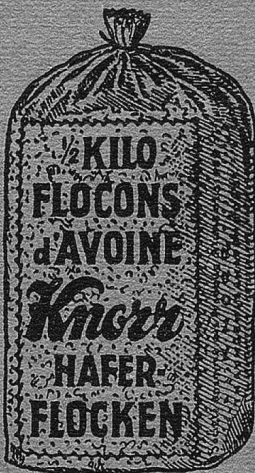
in den durchsichtigen Cellophane-Beuteln \frac{1}{2} Kilo 75 Cts.

Für jede Person werden abends 2-3 gehäufte Eßlöffel Knorr Haferflocken, 1 schwacher Eßlöffel Zucker mit 3 Eßlöffel Milch zusammengerührt, damit das Ganze über Nacht ziehen kann. Am anderen Morgen reibt man 1 Apfel samt der Schale und dem Gehäuse hinein, gibt den Saft einer viertel Zitrone und nach Belieben 1-2 Kaffelöffel geriebene Haselnüsse, Mandeln oder beides hinzu. Der Apfel kann auch durch Apfelsinen, Erdbeeren, Himbeeren, Johannisbeeren, Kirschen usw., je nach Jahreszeit, ersetzt bzw. ergänzt werden.