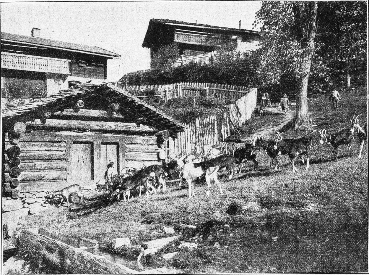
Motiv aus dem Prättigau. Heimkehr.