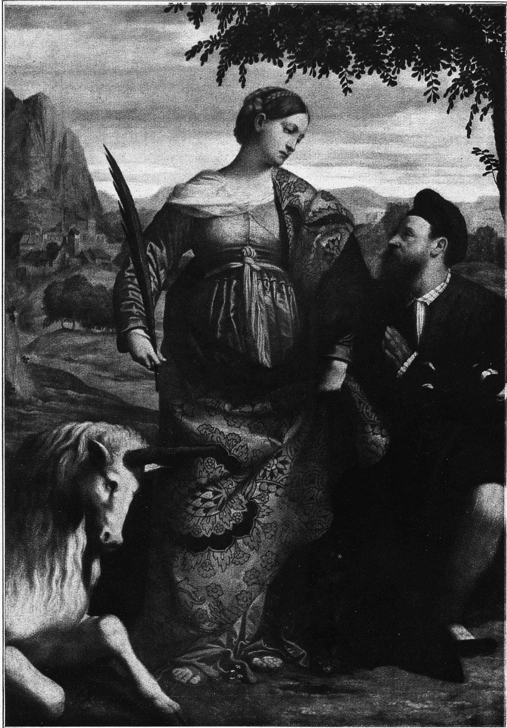
Die heilige Justina.

Gemälde von Moretto in der Gemäldegalerie des Hofmuseums in Wien.