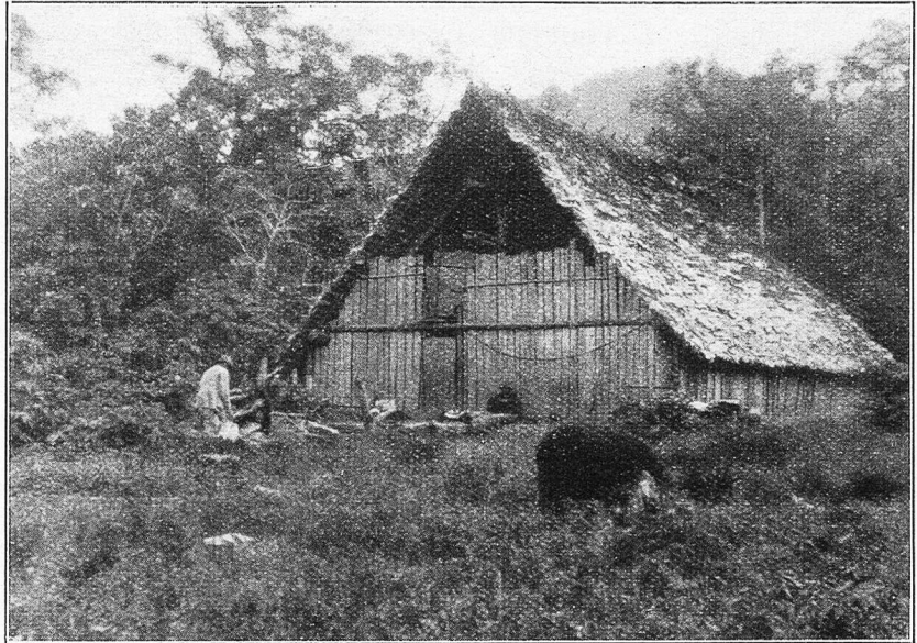
Bambus-Haus von Dumbo-Indianern in Baeza.

Da es noch sehr früh war, gedachte ich bis Mittag zu rasten und am Nachmittage bis zum Rio Bermejo (sprich Bermecho = roter Fluß) weiter zu marschieren. Kaum hatten wir uns aber zur Rast auf einige Steine niedergelassen, so erschien auch schon der alte Träger wieder, kniete vor mir nieder und flehte mit gefalteten