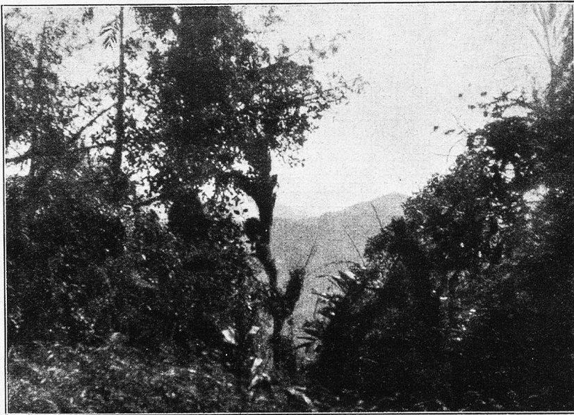
Sierra de Guacomayo. Tropischer Regenwald mit Überpflanzen.

ein gefährliches Untersinken gewesen. Allein der Unterkunfts-ort selbst bestand nur aus einem etwa acht Quadratmeter großen Blätterdach, das durch zwei Stecken schräg gestellt war. Einen Schutz gegen Regen bot es zwar nicht, immerhin war der Boden darunter nicht derart versumpft wie rund herum, so daß wir wenigstens hoffen konnten, unter dem Tambo ein Feuer zustande zu bringen. Das von den Indianern gesammelte Holz war allerdings völlig durchnäßt, und wir brauchten gut einen halben Liter Petrol, bis es endlich so weit brannte, daß wir ein Kochgeschirr auf-