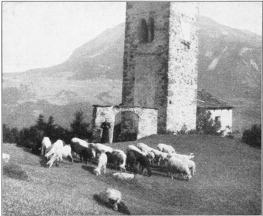
Frühlingsstudie bei Mons im Oberhalbstein. — Alte Kirche in Mons.

Jetzt tat er freiwillig und unangefragt, um was ihn Anneli und Christen anfänglich vergeblich ersucht hatten. Er siedelte zu seinen Kindern über und half selbst, einen Teil der Wände, zwischen denen er so lange gelebt, niederreißen, um das Häuschen zur Aufbewahrung von man-