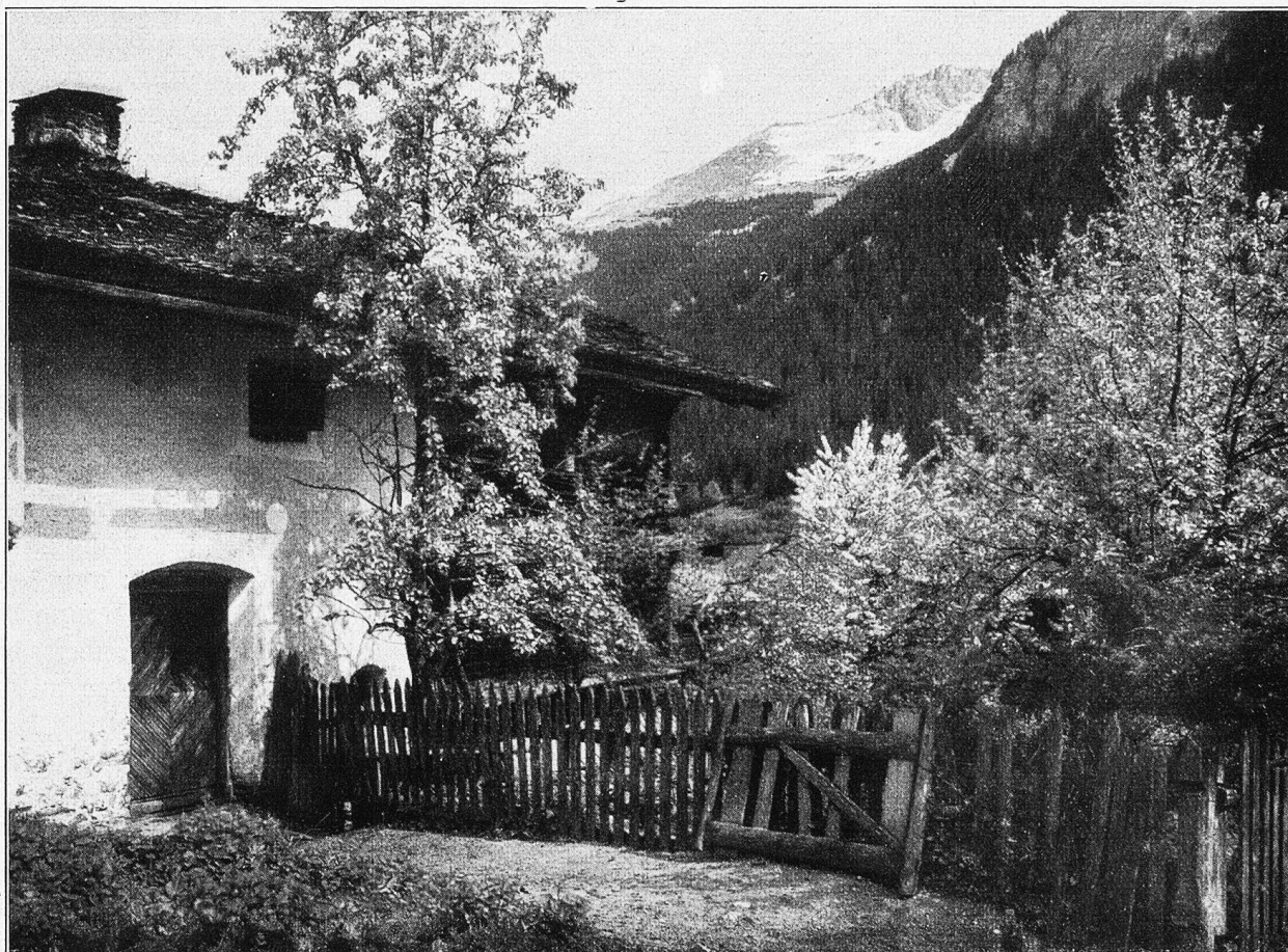
Oh schöne Frühlingszeit! Studie aus dem Brättigau.

abends nach diesen Tagesgeschäften in seinem einsamen Stübchen saß. Der Einblick in Stand und Gang der Haushaltung machte ihn alsbald mit einem Gedanken vertraut, dem er in der Abgeschiedenheit von aller bisher gewohnten geselligen Zerstreuung nur mit um so größerer Ruhe nachhängen konnte. „Es geht nicht anders, ich muß eine Frau haben,“ sagte er halblaut vor sich hin; „denn am Ende gibt es doch