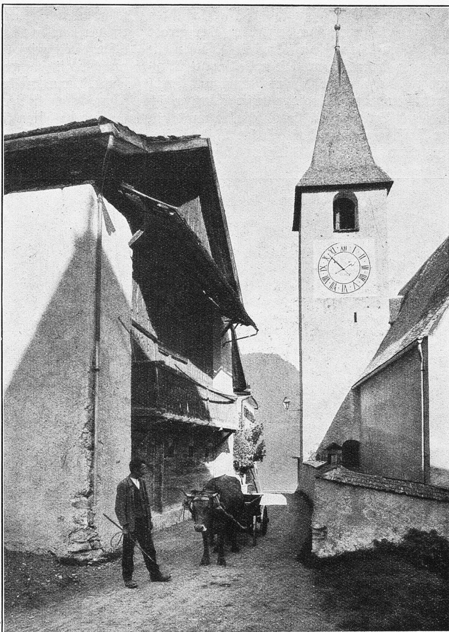
Dorfpartie und Kirche zu Wiesen ob Filisur.

Einer aber befand sich in diesem Zuge, der trotz aller Mühe, die er sich dazu gab, innerlich nicht recht froh werden konnte; und doch, sollte man meinen, hätte gerade er den rechten Grund zur Freude gehabt. Oder soll ein Vater sich nicht freuen, der sein Kind einem verständigen, wohlhabenden Manne verbunden weiß, der die geheimsten Herzenswünsche seiner Tochter in fast unerwartet glückliche Erfüllung gehen sieht? Das sagte sich Sepp selbst genugsam; er bedachte, daß der reichste Vater in weiter Umgebung mit Freude dem jungen Steinberger eine Tochter zum Weibe gegeben haben würde