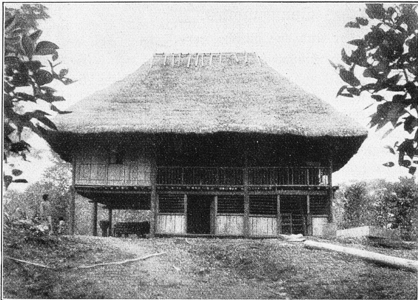
Von Jumbo-Indianern erbautes Kolonistenhaus in Archidona.

Schwestern und Patres von dem Josefinerorden in Turin der Seelsorge obliegen. Da ich von den Geistlichen Auskunft über die Möglichkeiten der Schifffahrt auf dem Napo zu erhalten hoffte, entschloß ich mich trotz der vorgerückten Stunde, den Patres einen Besuch zu machen. Sie hatten eben das Nachsteffen beendet und empfingen mich, besonders da ich italienisch sprach, sehr freundlich. Gerne gaben sie mir die gewünschten Auskünfte über den Napo und die Siedlungen der Indianer und zur Feier des Tages servierten sie ein allerdings sehr kleines Gläschen selbstgezogenen Weines. Neben der Seelsorge betätigten sich die Missionare vor allem als Krankenpfleger und suchen die Indianer, soweit ihnen dies möglich ist, vor der ärgsten Ausbeutung durch die Kolonisten zu schützen. Zur Zeit meines Aufenthaltes saßen aber gerade die Liberalen am Ruder und so fanden sie bei der Regierung in Quito für ihre wohlgemeinten Bemühungen wenig Gegenliebe. Da, wie bereits erwähnt, in Tena auch eine Anzahl Schwestern der Missionstätigkeit oblagen, interessierte es mich zu erfahren, wie diese nach dem Oriente gekommen seien. Eine Reise über die Kordillere und die Sumpfwälder ihrer Ostabhänge geht nämlich meist bis an die Grenze der physischen Leistungsfähigkeit eines kräftigen Mannes, und so schien es mir kaum glaublich, daß frisch zugereiste Europäerinnen auf diesem Wege Tena zu erreichen vermochten. Und doch war dem so. Auf meine Frage gab mir einer der Patres, der die Schwestern in Riobamba