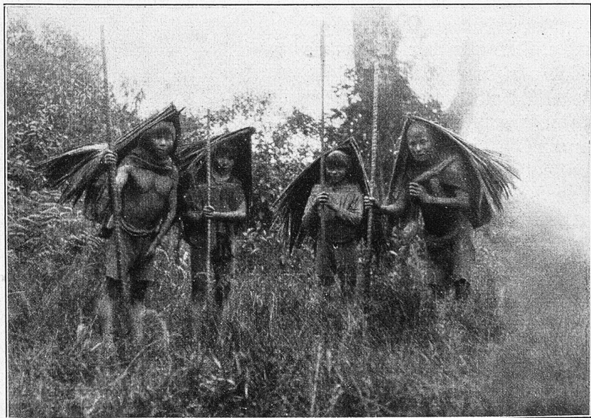
Lastentragende Yumbo-Indianer mit Speer und Blasrohr.