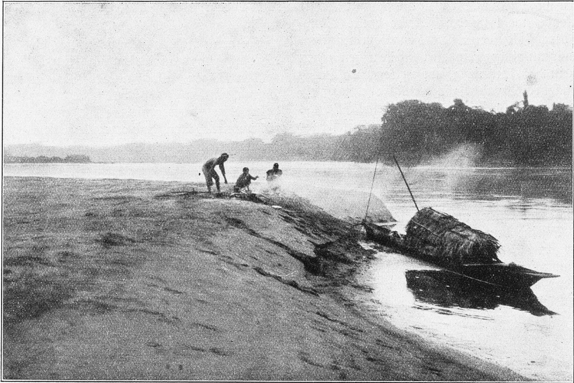
Lager bei der Einmündung des Rio Coca in den Napo.

Reise bis zur Einmündung des Rio Aguarico mit guten Ruderern etwa vier bis fünf Tage dauere und daß von dort gelegentlich kleine Dampfer bis Iquitos am Amazonas fahren. Ob sich in nächster Zeit eine solche Fahrgelegenheit bieten würde, wußte der Mann freilich nicht. Dagegen meinte er, sei es wahrscheinlich, daß in der nächsten Zeit, das heißt, sobald die Wasser- verhältnisse dies erlauben würden, eine Lancha von Armenia selbst zum Amazonas hinunter- fahren werde. Dieser kleine Dampfer habe sich anlässlich einer Revolution im peruanischen Iqui- tos nach Armenia geflüchtet und solle nun sei- nem Eigentümer, einem Herrn Israel, chinesi- schem Konsul in Iquitos, zurückgesandt werden. Von Armenia abwärts sollten auch keine Steine mehr vorkommen: „ni por rimedio“, nicht ein- mal als Heilmittel, meinte mein Wirt bekräfti- gend. Der Fluß habe von da weg reinen Tief- landcharakter und die Fahrt sei deshalb bei ge- nügender Vorsicht völlig gefahrlos, dagegen sinke der Wasserstand oft plötzlich, so daß größere Schiffe oft wochenlang festgehalten würden.