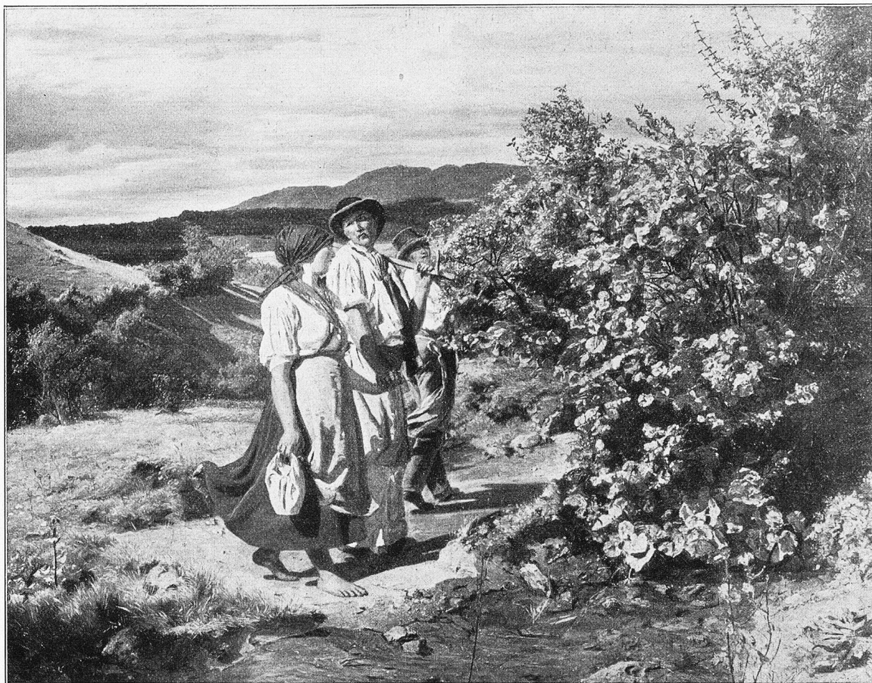
Heimkehr von der Arbeit. Nach einem Gemälde von Waldmüller.