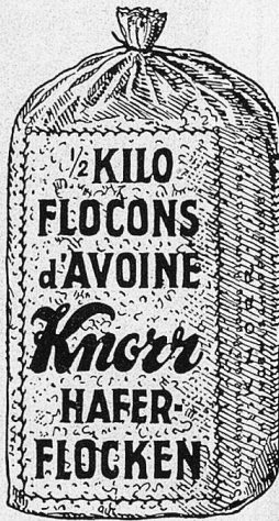
in den durchsichtigen Cellophane-Beuteln 1/2 Kilo 75 Cts.

Für jede Person werden abends 2-3 gehäufte Eßlöffel Knorr Haferflocken, 1 schwacher Eßlöffel Zucker mit 3 Eßlöffel Milch zusammengerührt, damit das Ganze über Nacht ziehen kann. Am anderen Morgen reibt man 1 Apfel samt der Schale und dem Gehäuse hinein, gibt den Saft einer viertel Zitrone und nach Belieben 1-2 Kaffelöffel geriebene Haselnüsse, Mandeln oder beides hinzu. Der Apfel kann auch durch Apfelsinen, Erdbeeren, Himbeeren, Johannisbeeren, Kirschen usw., je nach Jahreszeit, ersetzt bzw. ergänzt werden.